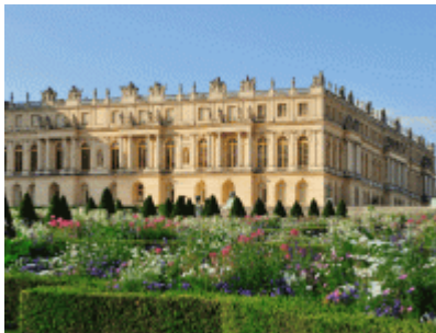
Château de Versailles

For exceptional moments, the region welcomes restaurants in places as unusual as they are prestigious. Firstly, at 58 Tour Eiffel, managed by the SODEXO group, which will open soon with the world-renowned chef Thierry Marx at the helm. The brasserie is located on the first floor of the Eiffel Tower.