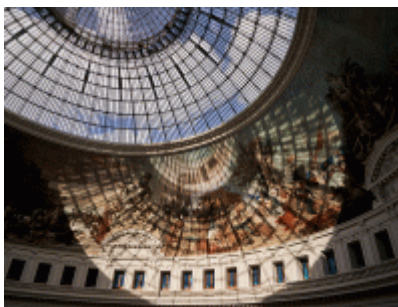
Bourse de Commerce_Pinault Collection

If your clients are more attracted to contemporary art and the excitement of the city, we recommend a lunch at the Halle aux Grains, the restaurant of the Bourse de Commerce - Fondation Pinault, a new cultural establishment in the heart of Paris. They can enjoy an exclusive view of Les Halles and the Centre Pompidou.