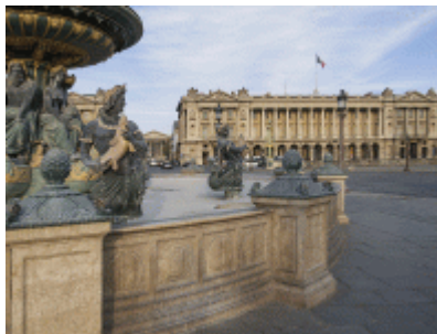
Hôtel de la Marine vu depuis la fontaine des Fleuves

First of all, the Hôtel de la Marine is an essential visit. After 3 years of renovation, this emblematic Parisian monument, located on the Place de la Concorde, will finally reopen next spring. If the spaces are sufficient in themselves, we still advise you to extend your visit to the two restaurant spaces accessible from next September. The starred chef Jean-François Piège has designed the menu for the restaurant that will line the courtyard of honour, while the Café Lapérouse, located to the south of the courtyard, will offer a lighter menu for all times of the day.