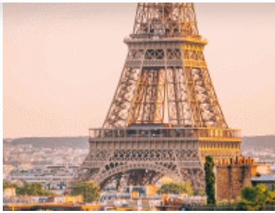
Tour Eiffel - CRT IDF/ATF/Liinks/Mary Quincy

For exceptional moments, the region welcomes restaurants in places as unusual as they are prestigious. Firstly, at 58 Tour Eiffel, managed by the SODEXO group, which will open soon with the world-renowned chef Thierry Marx at the helm. The brasserie is located on the first floor of the Eiffel Tower.