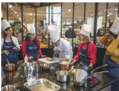
Ferrandi cours de cuisine aux Galeries Lafayette Haussmann - © Droits réservés GL

If your clients are more attracted to contemporary art and the excitement of the city, we recommend a lunch at the Halle aux Grains, the restaurant of the Bourse de Commerce - Fondation Pinault, a new cultural establishment in the heart of Paris. They can enjoy an exclusive view of Les Halles and the Centre Pompidou.