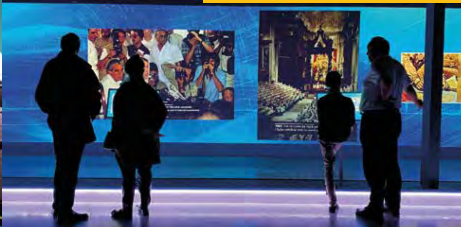
历史之城，拉德芬斯广场