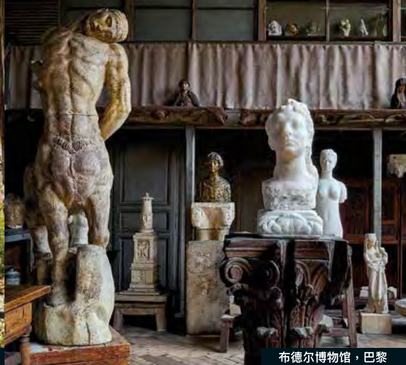
布德尔博物馆, 巴黎