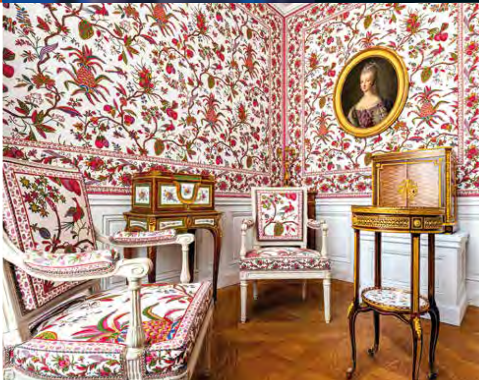
玛丽·安托瓦内特公寓，凡尔赛宫