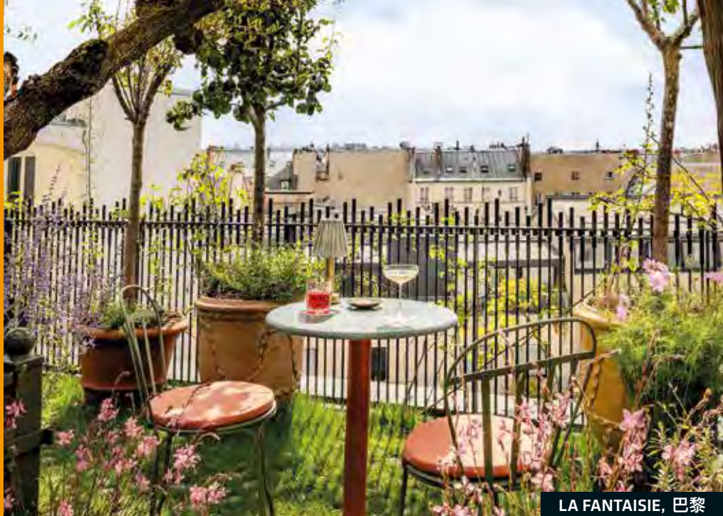
LA FANTAISIE, 巴黎