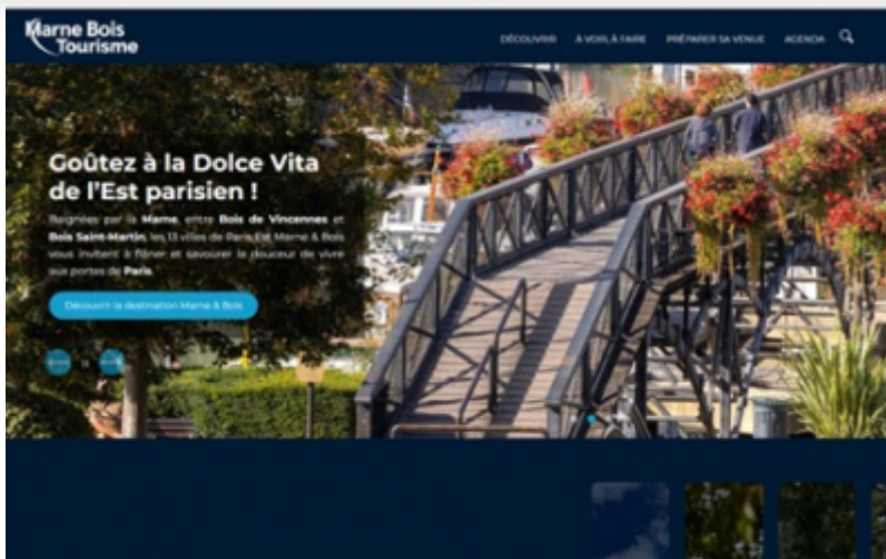
OT Paris Est Marne et Bois

L'Office de Tourisme du Territoire Paris Est Marne et Bois a lancé, le 1er juillet dernier, son nouveau site internet .