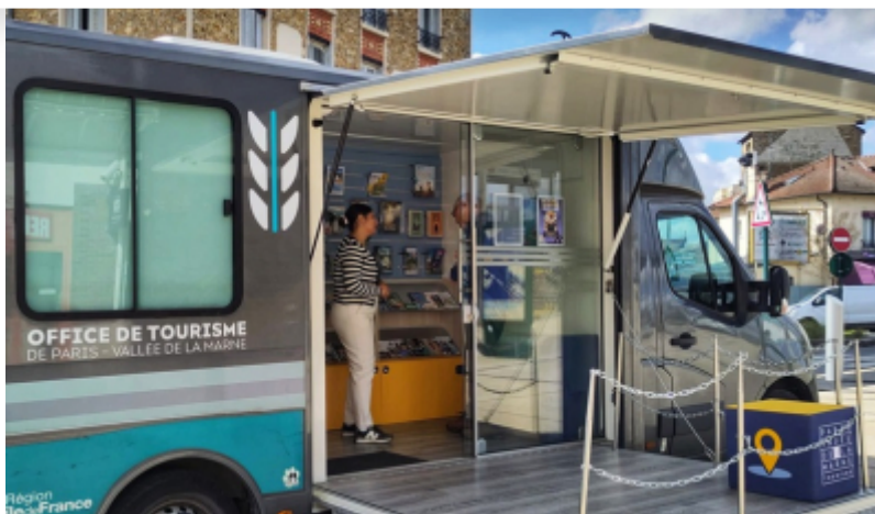
OT Paris-Vallée de la Marne

Depuis 2021, c'est à bord de son camion que l'Office de Tourisme de Paris-Vallée de la Marne reçoit ses visiteurs. Cette approche itinérante permet de desservir l'ensemble des douze communes de la communauté d'agglomération.