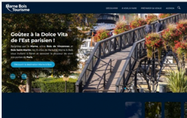
OT Paris Est Marne et Bois

L'Office de Tourisme du Territoire Paris Est Marne et Bois a lancé, le 1er juillet dernier, son nouveau site internet .