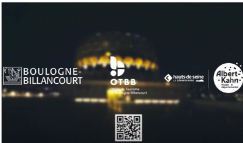
OT de Boulogne-Billancourt

L'Office de Tourisme de Boulogne-Billancourt lance une série de trois nouvelles vidéos promotionnelles . Ces courtes vidéos de moins de deux minutes valorisent la culture, les quartiers, l'architecture, les commerces et marchés, les parcs et jardins et le sport à Boulogne-Billancourt. Elles s'adressent à trois cibles : les clients des hôtels, les salons professionnels et les entreprises, et les Boulonnais.