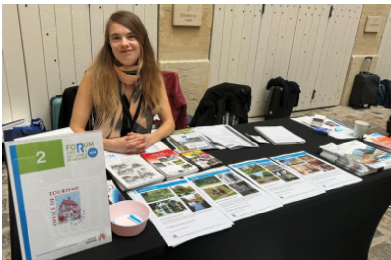
OT de Maisons-Laffitte

L'Office de Tourisme de Maisons-Laffitte a participé au Forum des Loisirs Culturels Franciliens, qui s'est tenu le 17 septembre dernier dans le cadre exceptionnel de l'Hôtel de la Marine.