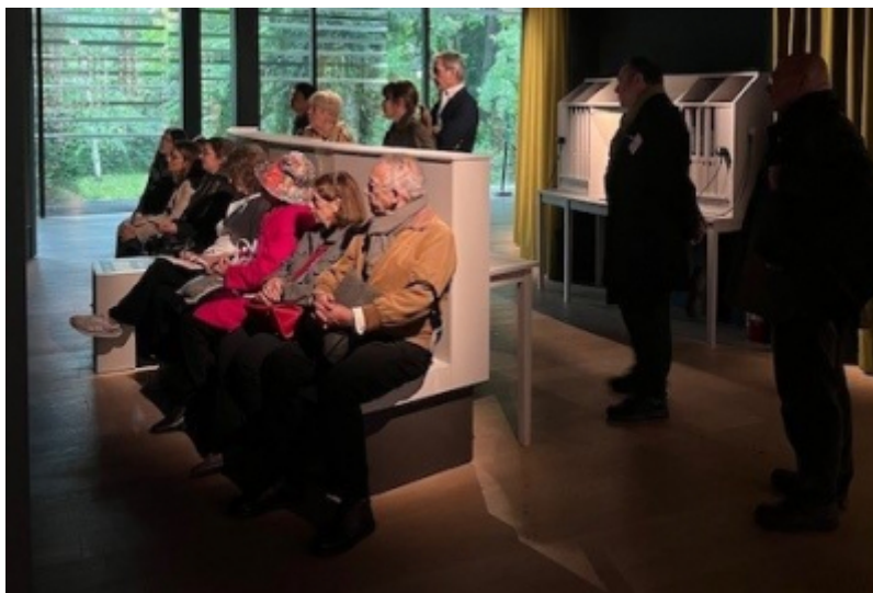
OT de Boulogne-Billancourt

L'Office de Tourisme de Boulogne-Billancourt a organisé le 9 octobre dernier, de 13h30 à 18h45, un éductour dédié aux journalistes du Tourisme et de la Culture.