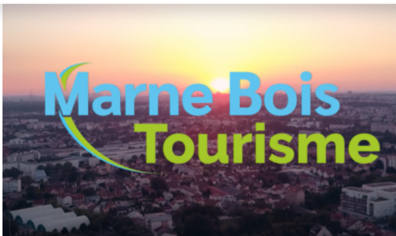
Marne Bois Tourisme

Goûtez à la Dolce Vita de l'Est Parisien ! Ainsi s'intitule le nouveau film promouvant la destination Paris Est Marne et Bois.