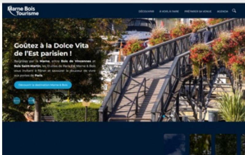
OT Paris Est Marne et Bois

L'Office de Tourisme du Territoire Paris Est Marne et Bois a lancé, le 1er juillet dernier, son nouveau site internet .