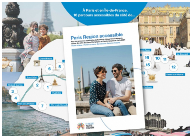
Choose Paris Region

Afin de permettre à un large public de découvrir la destination, Choose Paris Region a créé " Paris Region accessible ".