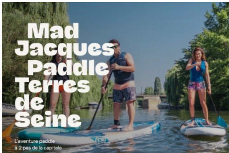
OT Terres de Seine