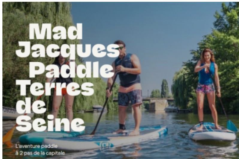
OT Terres de Seine