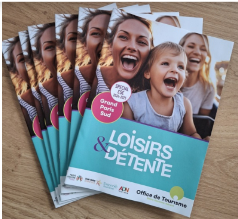
OT Grand Paris Sud

En réponse aux attentes des sites de loisirs in- et outdoor, l'Office de Tourisme Grand Paris Sud a participé, les 5 et 6 juin derniers, au Salon Solutions CSE Marne-la-Vallée, rendez-vous incontournable des acteurs des CSE.