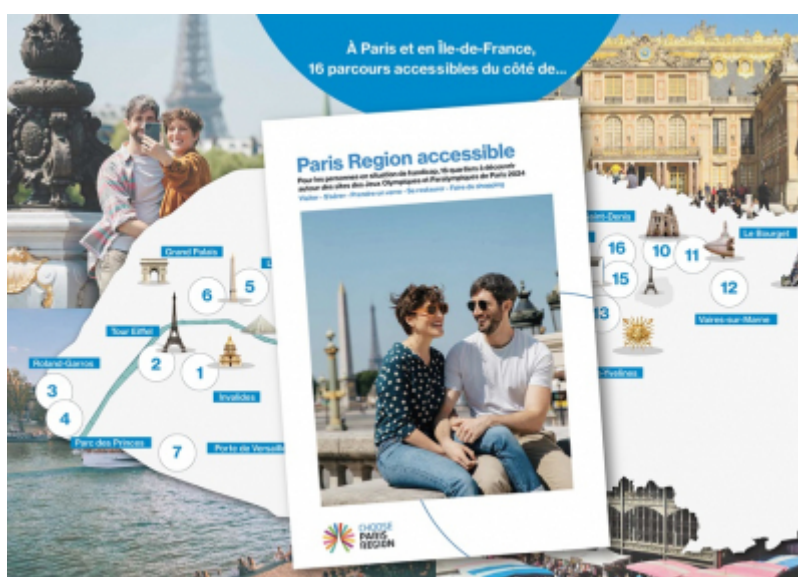
Choose Paris Region

Afin de permettre à un large public de découvrir la destination, Choose Paris Region a créé " Paris Region accessible ".