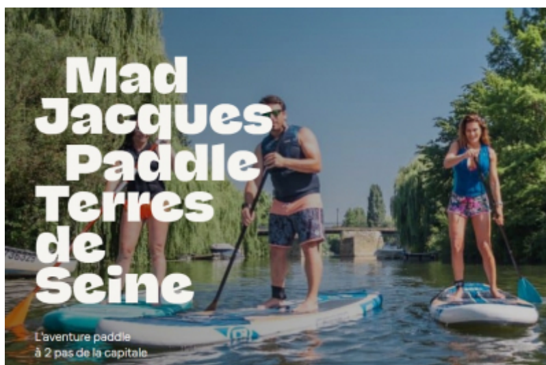
OT Terres de Seine