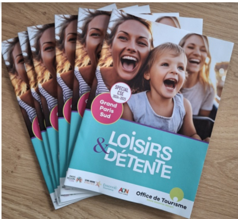
OT Grand Paris Sud

En réponse aux attentes des sites de loisirs in- et outdoor, l'Office de Tourisme Grand Paris Sud a participé, les 5 et 6 juin derniers, au Salon Solutions CSE Marne-la-Vallée, rendez-vous incontournable des acteurs des CSE.