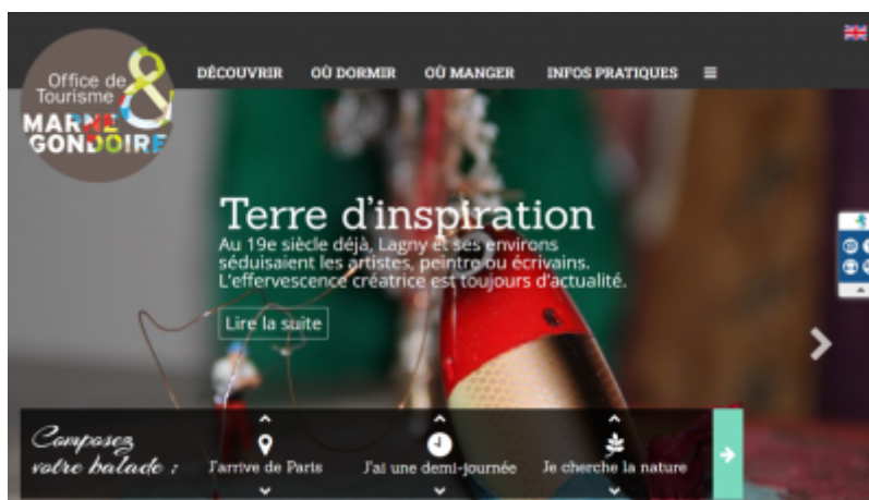
OT de Marne et Gondoire

Bien que l'Office de Tourisme de Marne et Gondoire soit pleinement engagé dans une démarche Tourisme & Handicaps, son site internet n'était pas complètement accessible.