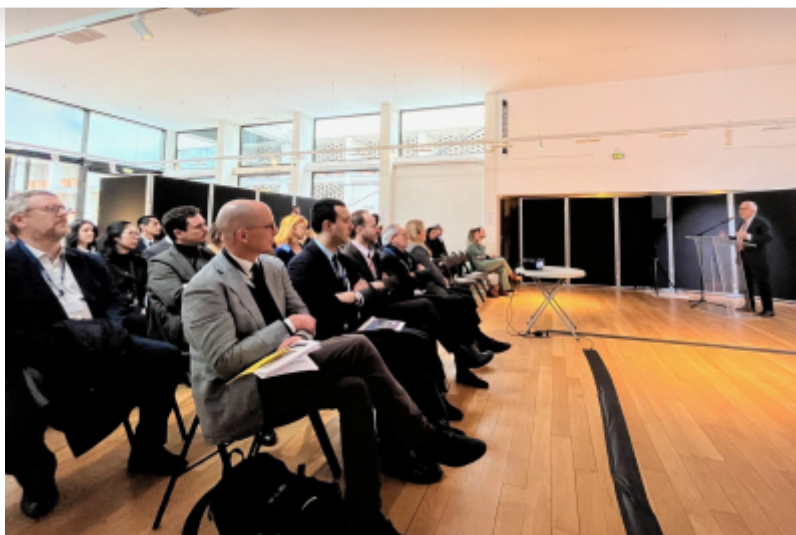
OT de Boulogne-Billancourt

L'Office de Tourisme de Boulogne-Billancourt a organisé, le 6 mars dernier, un débat sur le thème des Jeux Olympiques et Paralympiques 2024 à destination des 26 hôteliers du territoire.