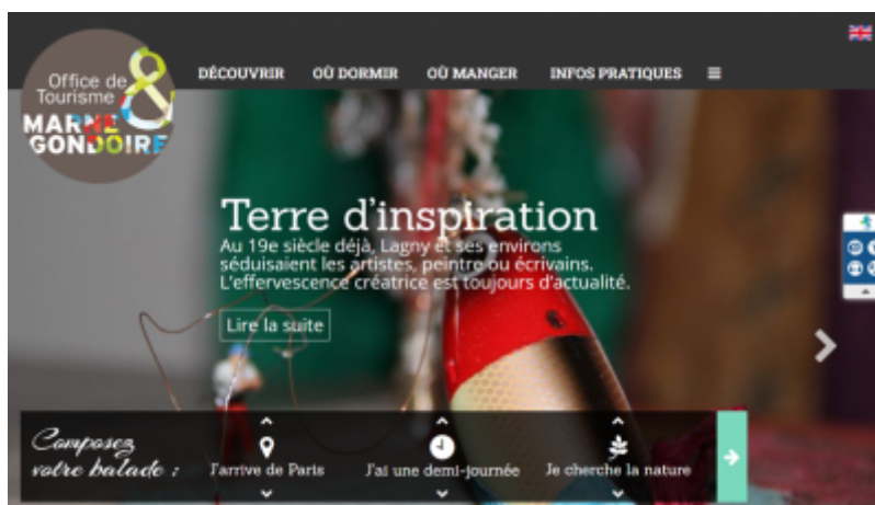
OT de Marne et Gondoire

Bien que l'Office de Tourisme de Marne et Gondoire soit pleinement engagé dans une démarche Tourisme & Handicaps, son site internet n'était pas complètement accessible.