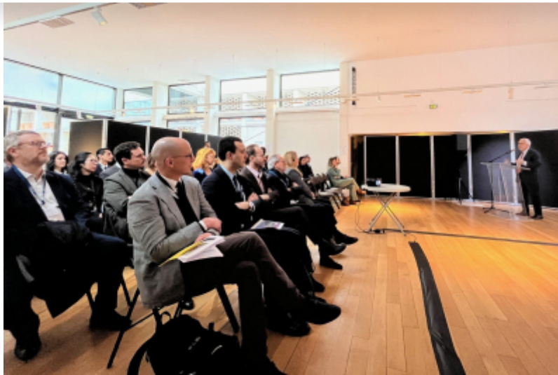
OT de Boulogne-Billancourt

L'Office de Tourisme de Boulogne-Billancourt a organisé, le 6 mars dernier, un débat sur le thème des Jeux Olympiques et Paralympiques 2024 à destination des 26 hôteliers du territoire.