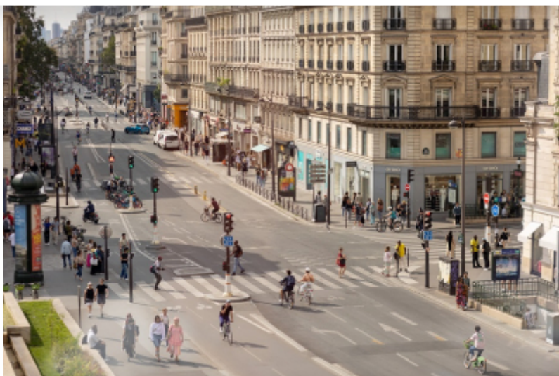
Joséphine Brueder/Ville de Paris