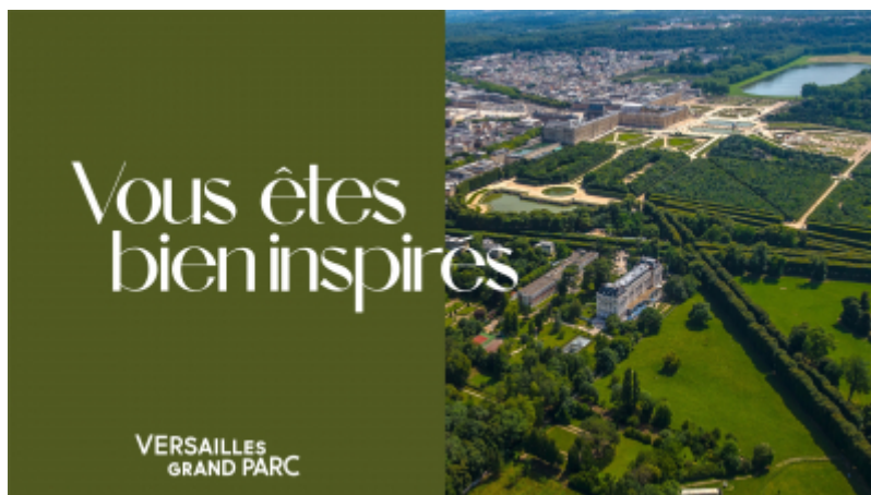
OT Versailles Grand Parc

Destination Versailles Grand Parc, marque de destination qui valorise l'offre touristique des 18 communes de Versailles Grand Parc, renouvelle son identité visuelle et ses codes de communication en faisant appel à LEON, agence de référence dans le secteur du tourisme.