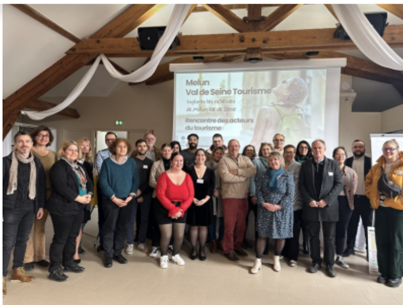
OT Melun Val de Seine

L'Office de Tourisme Melun Val de Seine a présenté son bilan 2023 ainsi que son plan d'actions et de promotion 2024, le 6 février dernier, à la Ferme d'Auxonettes à Saint-Fargeau-Ponthierry.