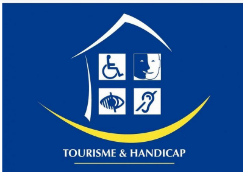
Tourisme &amp; Handicap

Participez à l'attractivité de la Région en participant à la formation Tourisme & Handicap à destination des conseillers en séjour, les 7 et 8 mars prochains. Celle-ci vise à renforcer les compétences nécessaires pour accueillir et servir efficacement les visiteurs en situation de handicap.