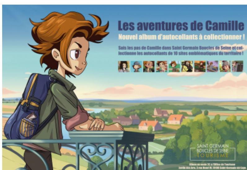
OT Saint Germain Boucles de Seine

A l'heure du numérique et des nombreuses applications, l'Office de Tourisme Saint Germain Boucles de Seine mise sur un concept simple et bien connu par des générations entières : l'album d'autocollants à collectionner. C'est ainsi qu'est né Camille !