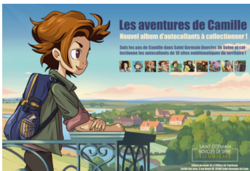
OT Saint Germain Boucles de Seine

A l'heure du numérique et des nombreuses applications, l'Office de Tourisme Saint Germain Boucles de Seine mise sur un concept simple et bien connu par des générations entières : l'album d'autocollants à collectionner. C'est ainsi qu'est né Camille !