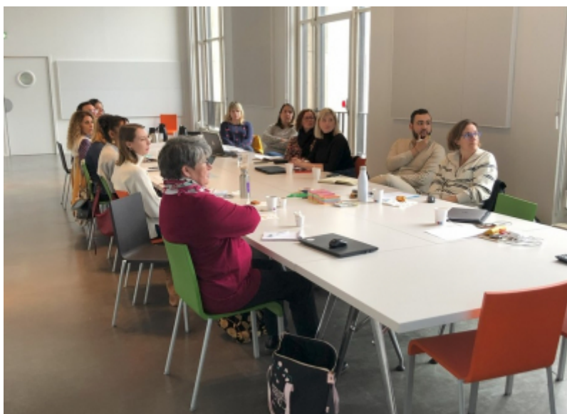
Choose Paris Region

Les 14 structures qui composent le groupe projet "Création d'une ligne de produits boutique exclusive pour les Offices de Tourisme d'Ile-de-France" se sont réunies pour travailler en "format ateliers" les 19 et 20 octobre à la Cité de l'architecture à Paris, et le 14 novembre au Musée français de la Carte à jouer à Issy-les-Moulineaux.