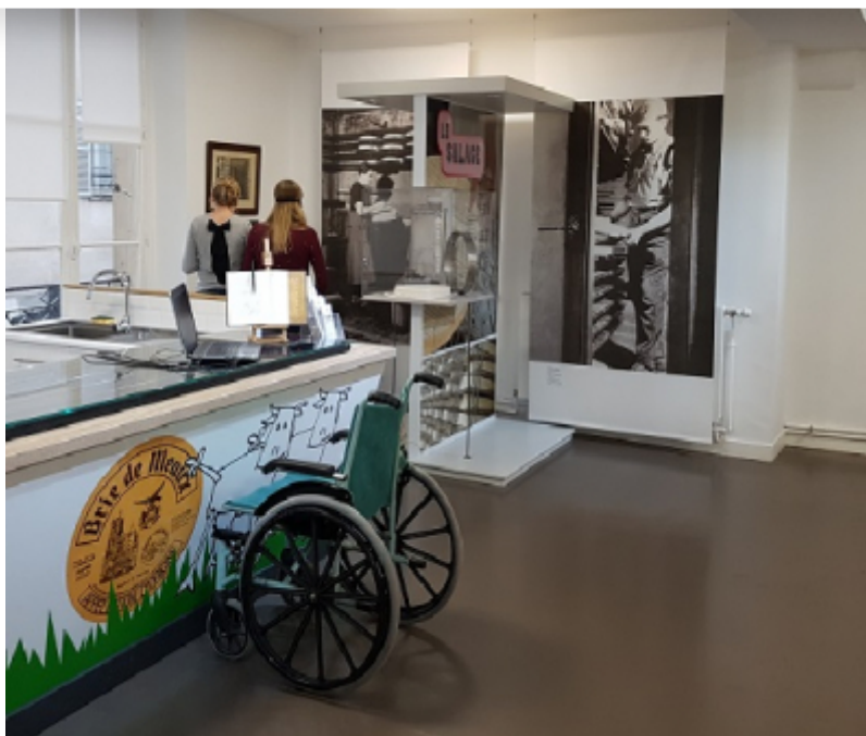
CRT Paris Ile-de-France