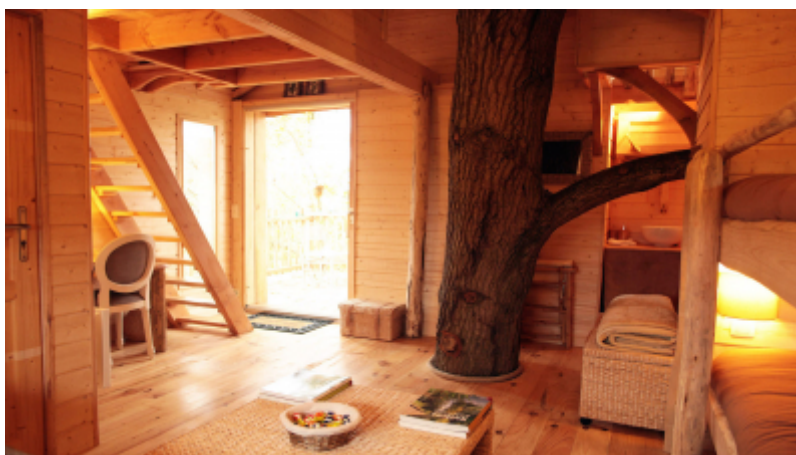
Les Cabanes du Moulin

Entre les modifications tarifaires de la taxe de séjour, l'accompagnement des porteurs d'hébergements touristiques, la gestion des conflits d'usages avec les propriétaires de meublés de tourisme..., Meaux Marne Ourcq Tourisme a décidé de mettre en place un temps d'échange avec les 48 communes de son territoire pour parler de l'hébergement touristique.