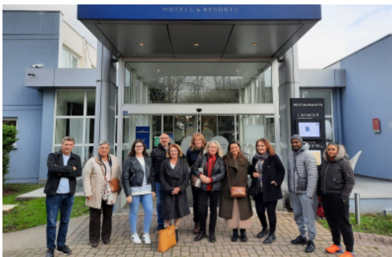
OT Grand Paris Sud

Le 24 novembre dernier, l'Office de Tourisme Grand Paris Sud a lancé son « Club Tourisme Groupes » en invitant les clients qui ont sollicité l'OT pour l'organisation de visites du territoire à participer à un éductour.