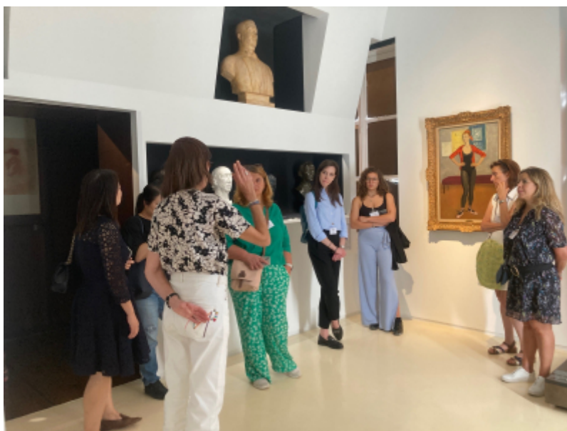
OT de Boulogne-Billancourt

L'Office de Tourisme de Boulogne-Billancourt a organisé, le 10 octobre dernier, un éductour dédié aux chargés de mission des ambassades ainsi qu'aux directeurs d'agences événementielles et réceptives.