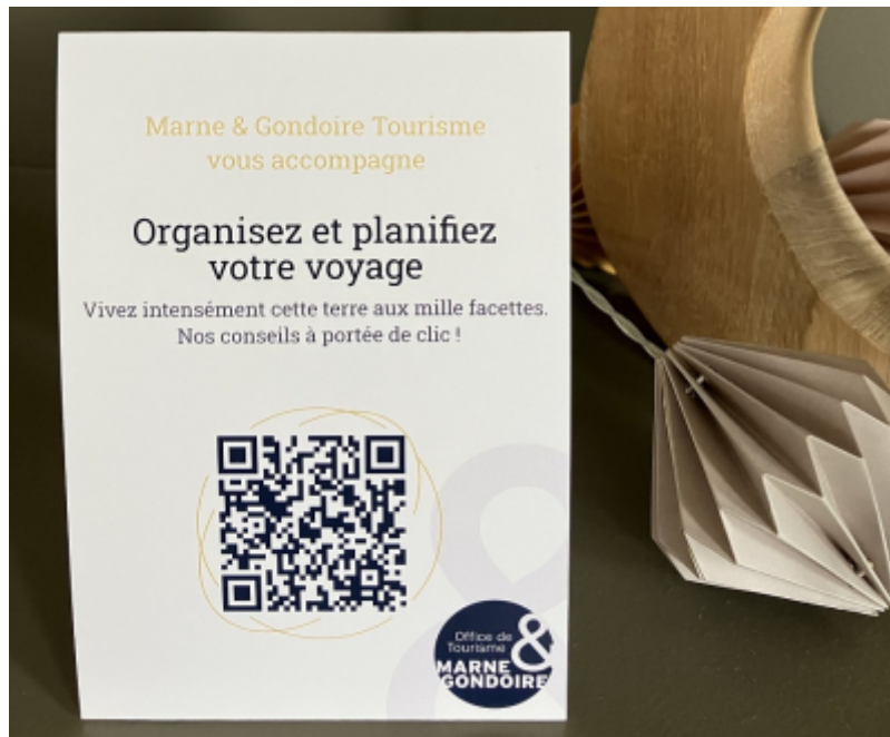
OT Marne et Gondoire

Avec la complicité de la société FeelCity (Cog Trotteur) , l'Office de Tourisme Marne & Gondoire a lancé une web app de conseil en séjour, un outil à double vocation :