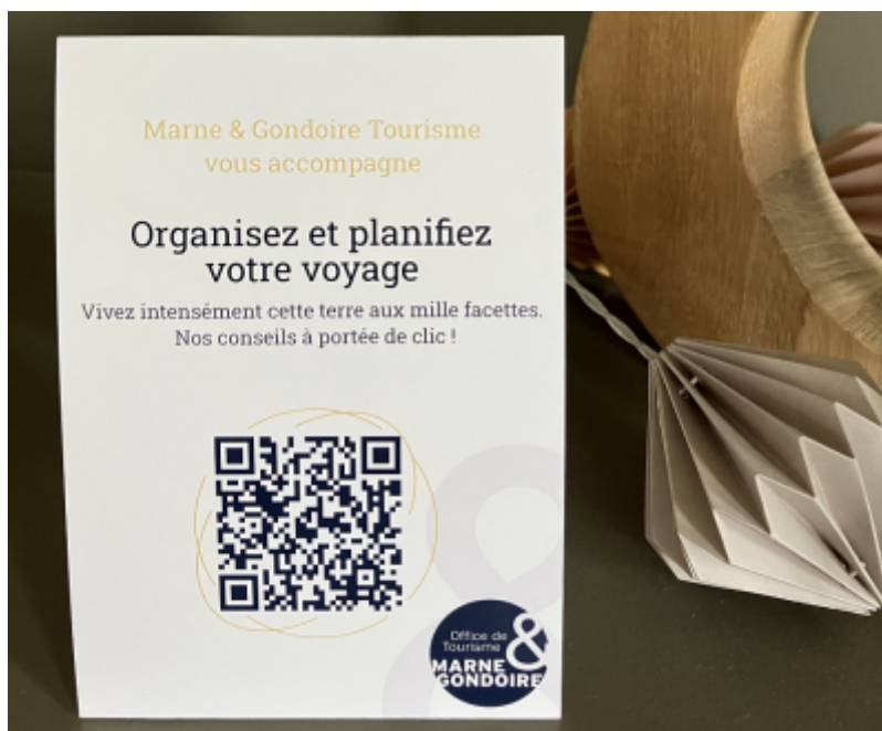
OT Marne et Gondoire

Avec la complicité de la société FeelCity (Cog Trotteur) , l'Office de Tourisme Marne & Gondoire a lancé une web app de conseil en séjour, un outil à double vocation :