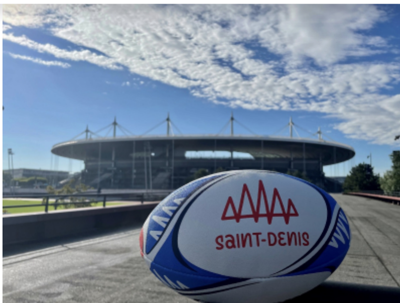
Rugby World Cup France 2023