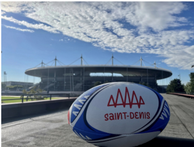
Rugby World Cup France 2023