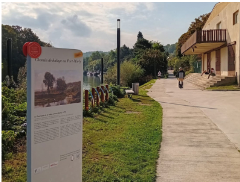
OT Saint Germain Boucles de Seine

Dans le cadre du Contrat Destination Impressionnisme Normandie - Paris Île-de-France , huit nouveaux parcours pédestres jalonnés de reproductions de tableaux ont été créés par l'Office de Tourisme Intercommunal Saint Germain Boucles de Seine. Ce projet est soutenu financièrement par la Région Île-de-France.