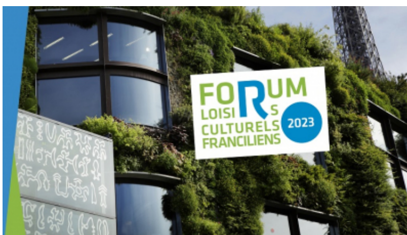
Musée du quai Branly - Jacques Chirac

Événement incontournable de la rentrée et attendu chaque année par les partenaires de Visit Paris Region, le Forum des Loisirs Culturels Franciliens a réuni 69 acteurs de l'offre culturelle d'Île-de-France: musées, monuments, châteaux, offices de tourisme, comités départementaux ... afin de promouvoir leur actualité, leurs visites guidées et leur billetterie.