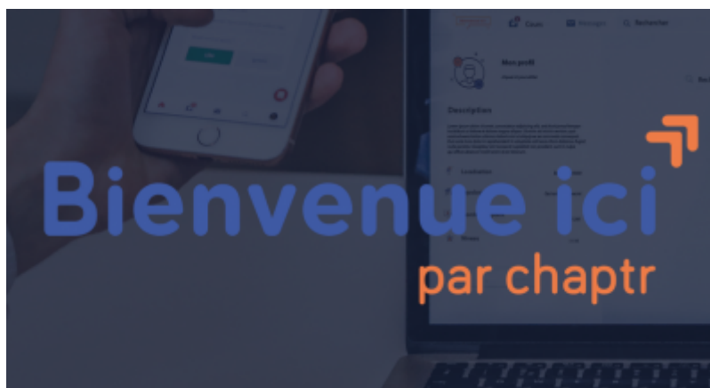
Bienvenue ici Par Chaptr