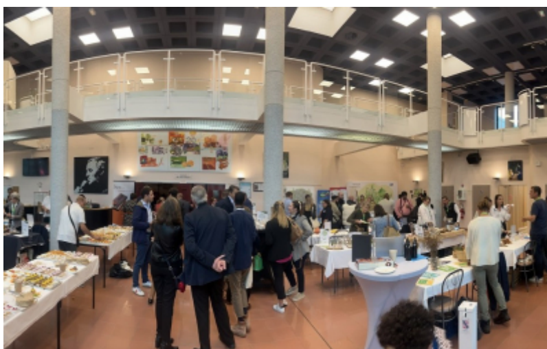
OT Grand Roissy

Le 21 septembre dernier, l'Office de Tourisme Grand Roissy a invité les hôteliers et les restaurateurs de son territoire à réfléchir à la problématique du tourisme durable.