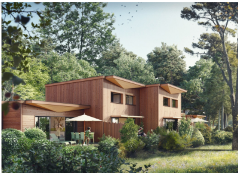
Village nature Paris

Pour faire de la région Île-de-France la meilleure destination touristique mondiale et contribuer à sa transition durable, les objectifs du Fonds Régional pour le Tourisme et ses critères d'attribution de subventions aux projets touristiques évoluent vers plus d'éco-conditionnalité.