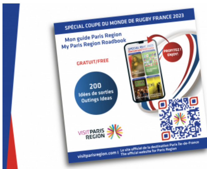
CRT Paris Ile-de-France