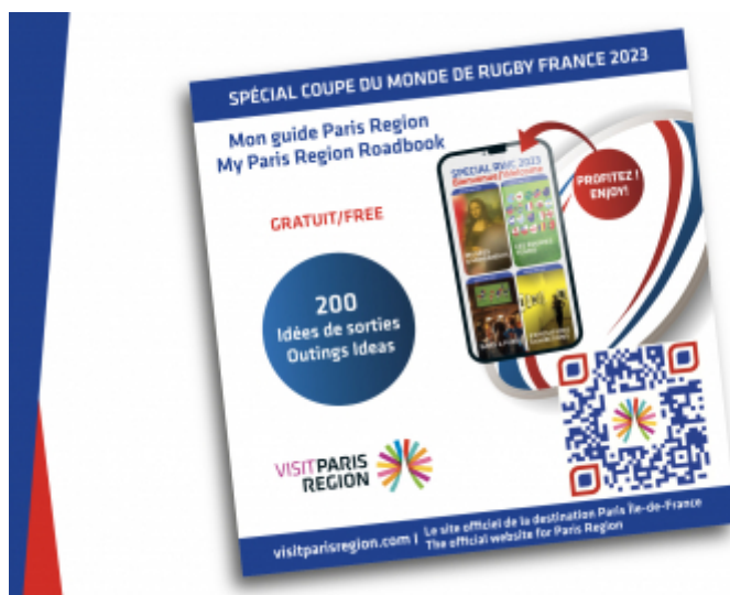
CRT Paris Ile-de-France