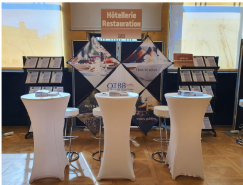
Office de Tourisme de Boulogne-Billancourt