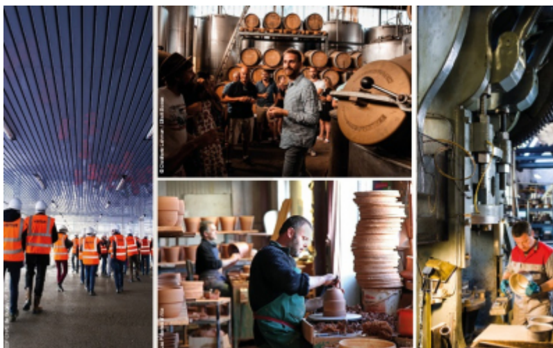
Entreprise et Découverte

Depuis plus d'un an, le Comité Régional du Tourisme Paris Ile-de-France accompagne l'association Entreprise et Découverte dans le diagnostic de l'offre de visite d'entreprises en Ile-de-France et sa structuration. Le réseau des Offices de Tourisme franciliens a également été mis à contribution pour ce référencement avec la volonté commune de faire émerger dans chaque secteur d'activité les pépites qui figurent la richesse et l'excellence de la région dans les différents secteurs de l'artisanat à l'industrie.