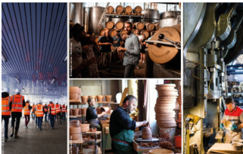
Entreprise et Découverte

Depuis plus d'un an, le Comité Régional du Tourisme Paris Ile-de-France accompagne l'association Entreprise et Découverte dans le diagnostic de l'offre de visite d'entreprises en Ile-de-France et sa structuration. Le réseau des Offices de Tourisme franciliens a également été mis à contribution pour ce référencement avec la volonté commune de faire émerger dans chaque secteur d'activité les pépites qui figurent la richesse et l'excellence de la région dans les différents secteurs de l'artisanat à l'industrie.