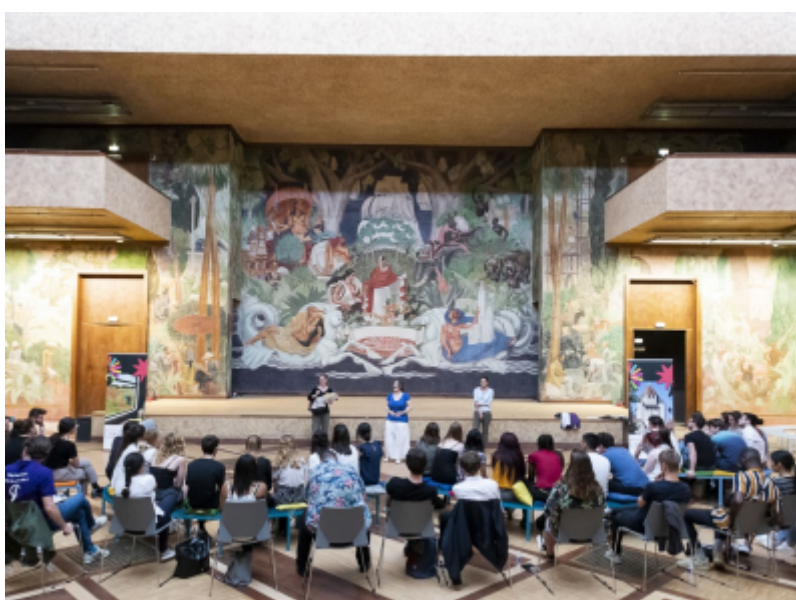
CRT Paris IDF_Cédric Helsly

La rencontre annuelle des Offices de Tourisme franciliens se tiendra jeudi 6 avril, de 9h30 à 13h, à l'Hôtel l'Echiquier Opéra Paris, situé à proximité du CRT.