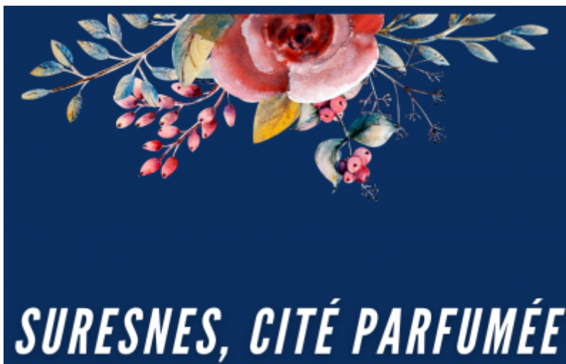
OT de Suresnes