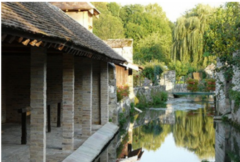
Commune de Flagy

A la une : votez pour Flagy qui représente l'Île-de-France au concours du « Village préféré des Français » 2023 !