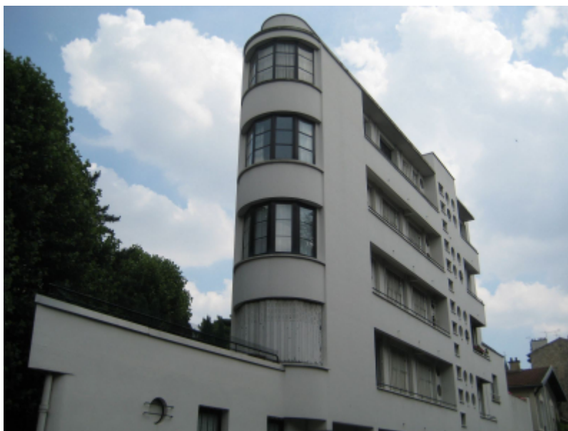
OT de Boulogne-Billancourt

L'Office de Tourisme de Boulogne-Billancourt va lancer au printemps 2023 une application avec Citygem : des parcours 100% gratuits en français et en anglais feront découvrir ou redécouvrir aux visiteurs les merveilles urbaines qui les entourent.