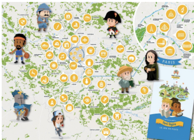
CRT Paris IdF

Ce sont désormais 43 aventures dans les 8 départements d'Ile-de-France qui composent l'application gratuite Paris Region Aventures, le jeu de piste géant adapté aux enfants.