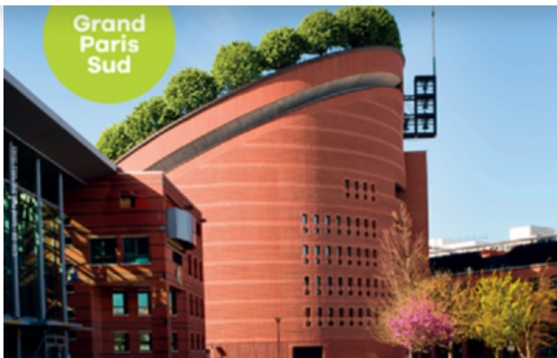
OT Grand Paris Sud

Une première : la toute nouvelle brochure « Escapades Groupes 2022-2023 », éditée par l'Office de Tourisme Grand Paris Sud !