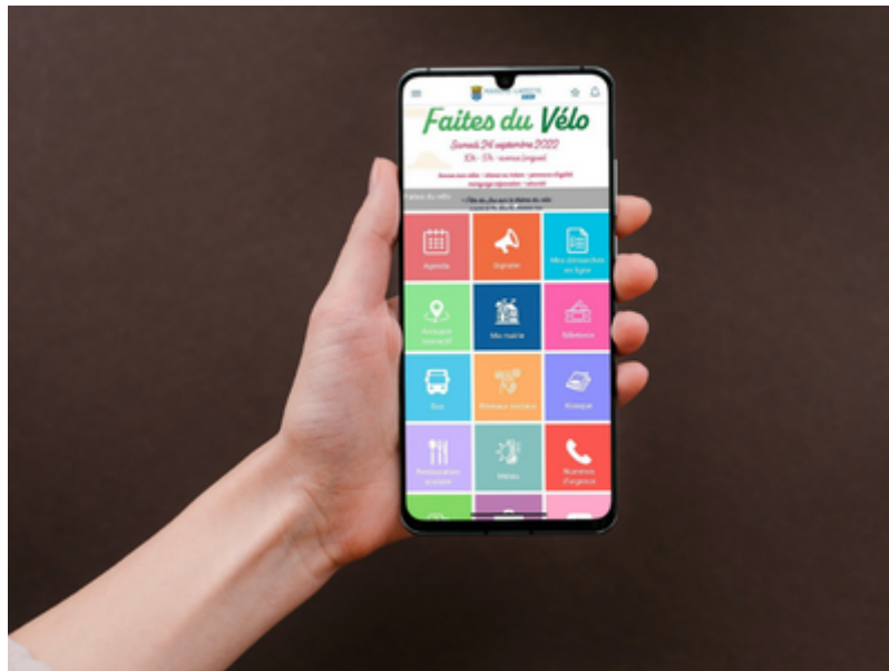
OT de Maisons-Laffitte

La ville de Maisons-Laffitte a créé, en avril dernier, l'application mobile "Maisons-Laffitte & moi" afin de faciliter le quotidien des mansonniers et des visiteurs, et de mieux les informer sur l'actualité du territoire.