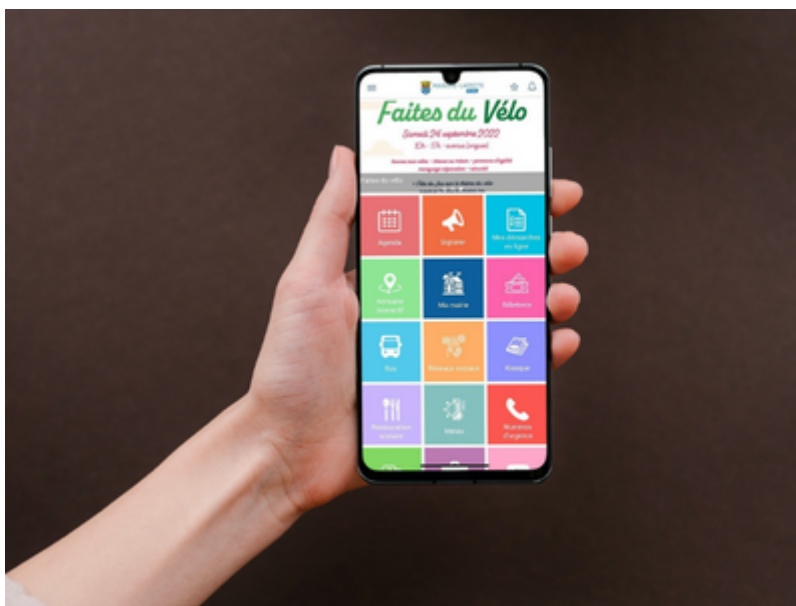
OT de Maisons-Laffitte

La ville de Maisons-Laffitte a créé, en avril dernier, l'application mobile "Maisons-Laffitte & moi" afin de faciliter le quotidien des mansonniers et des visiteurs, et de mieux les informer sur l'actualité du territoire.