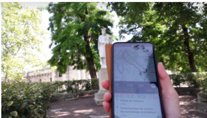
OT de Vincennes

Bougeott est une application, créée en 2020, par la Région Ile-de-France afin d'inciter les visiteurs à découvrir le patrimoine régional.