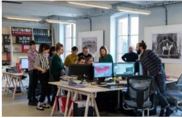
Marc Damage / CENTQUATRE-PARIS

Retrouvez les offres d'emplois et de stages diffusées par le réseau sur le portail professionnel du CRT .