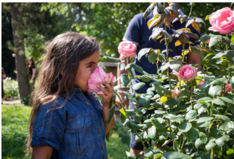
A.Laurin / CRT Paris Ile-de-France