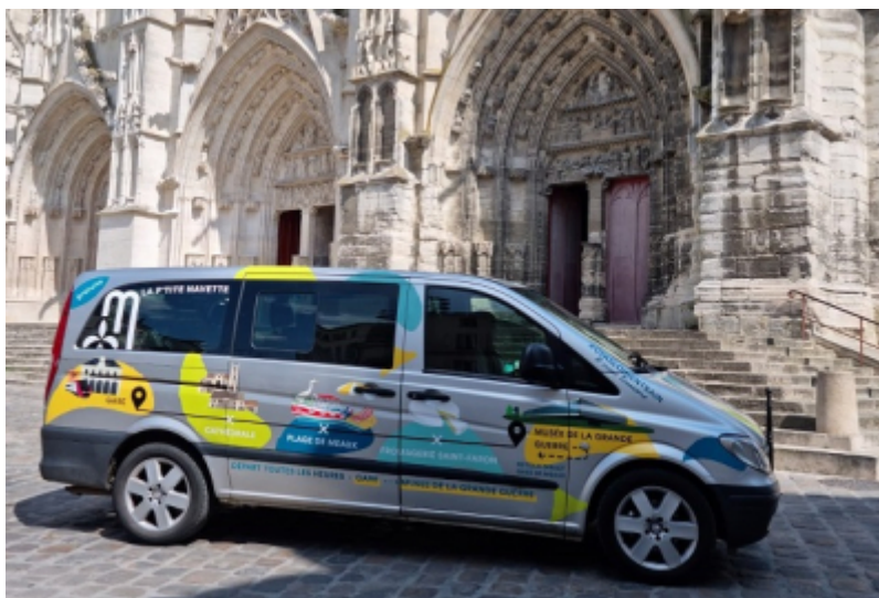
Meaux Marne Ourcq Tourisme

Afin de travailler le « dernier kilomètre » reliant la gare de Meaux au Musée de la Grande Guerre et d'améliorer la desserte du musée notamment le dimanche, Meaux Marne Ourcq Tourisme, en partenariat avec la Communauté d'agglomération du Pays de Meaux et Germinale (association de réinsertion) met en place un minibus à destination des visiteurs.