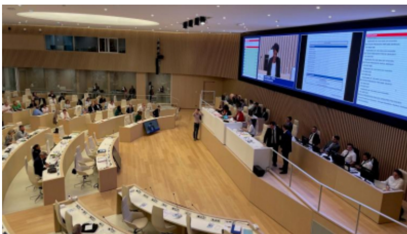
CRT Paris Ile-de-France