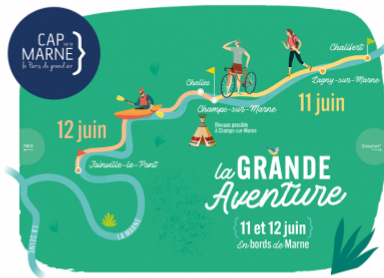
Cap sur la Marne

Le collectif Cap sur la Marne et Grand Paris nommé "Cap sur la Marne"