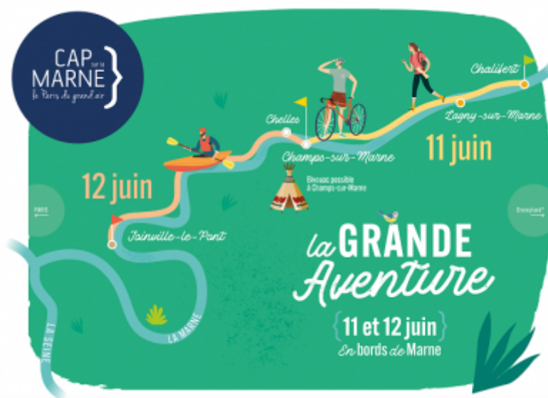
Cap sur la Marne

Le collectif Cap sur la Marne et Grand Paris nommé "Cap sur la Marne"