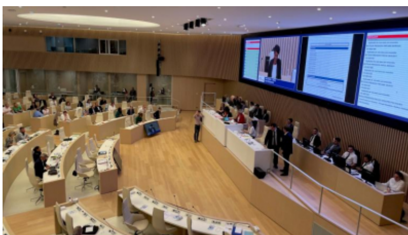
CRT Paris Ile-de-France