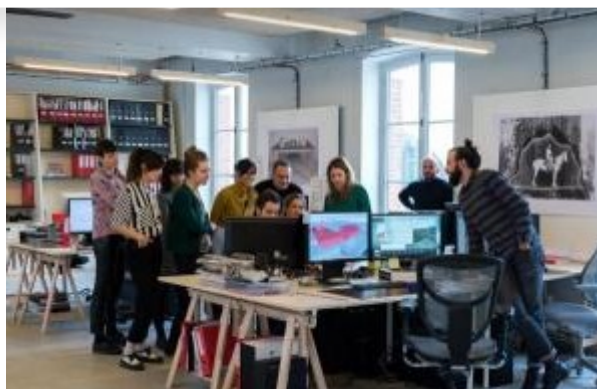
Marc Damage / CENTQUATRE-PARIS

Retrouvez les offres d'emplois et de stages diffusées par le réseau sur le portail professionnel du CRT .