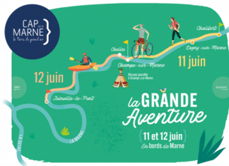
Cap sur la Marne

Le collectif Cap sur la Marne et Grand Paris nommé "Cap sur la Marne"