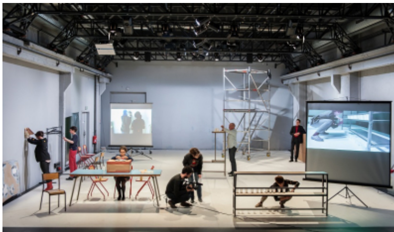
Ouidade Soussi Chiadmi

Faut-il proposer une ou des expériences ? Proposer une expérience pour tous ou des expériences à chacun ?