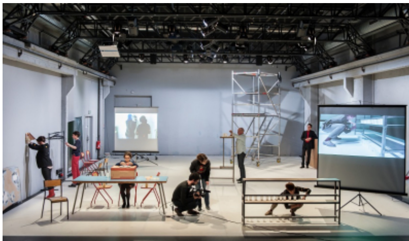
Ouidade Soussi Chiadmi

Faut-il proposer une ou des expériences ? Proposer une expérience pour tous ou des expériences à chacun ?