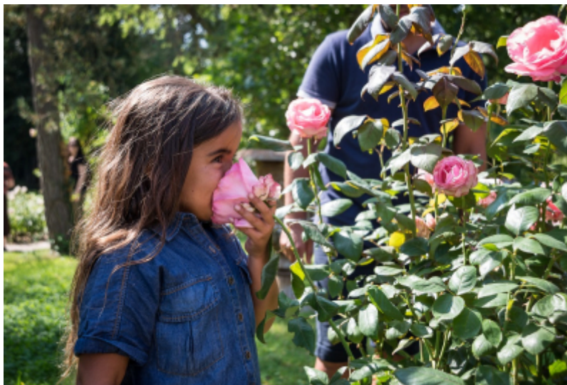
A.Laurin / CRT Paris Ile-de-France