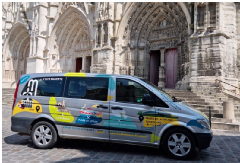
Meaux Marne Ourcq Tourisme

Afin de travailler le « dernier kilomètre » reliant la gare de Meaux au Musée de la Grande Guerre et d'améliorer la desserte du musée notamment le dimanche, Meaux Marne Ourcq Tourisme, en partenariat avec la Communauté d'agglomération du Pays de Meaux et Germinale (association de réinsertion) met en place un minibus à destination des visiteurs.