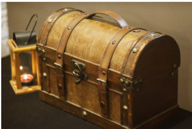
Office de Tourisme du Pays Houdanais

L'Office de Tourisme du Pays Houdanais, en collaboration avec le Donjon de Houdan, a conçu un escape game qui s'est déroulé les 23 et 27 avril dans le donjon du XII e siècle.