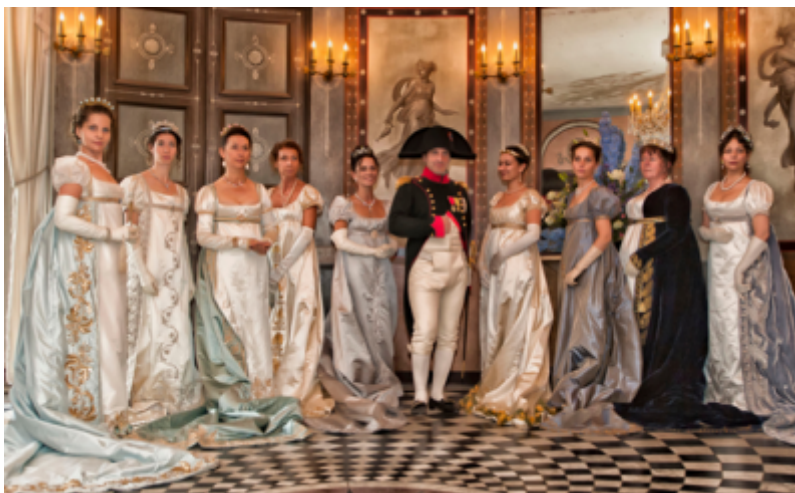
Office de Tourisme de Rueil-Malmaison

Située à huit kilomètres à l'ouest de Paris, Rueil-Malmaison, ville impériale, possède un patrimoine historique exceptionnel, marqué par la présence de Napoléon Bonaparte et de l'Impératrice Joséphine au Château de Malmaison.