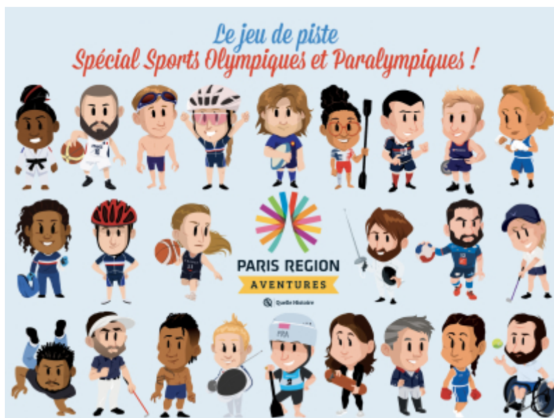
CRT Paris IdF

Après 35 aventures territoriales qui permettent d'explorer la région, l'application du CRT propose une nouvelle fonctionnalité avec la possibilité de jouer de chez soi !