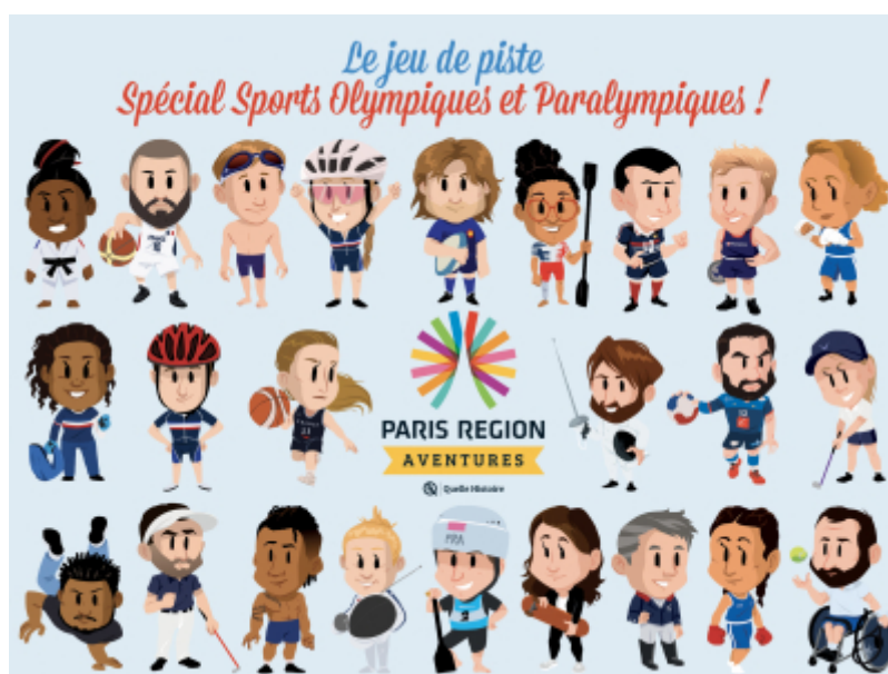
CRT Paris IdF

Après 35 aventures territoriales qui permettent d'explorer la région, l'application du CRT propose une nouvelle fonctionnalité avec la possibilité de jouer de chez soi !