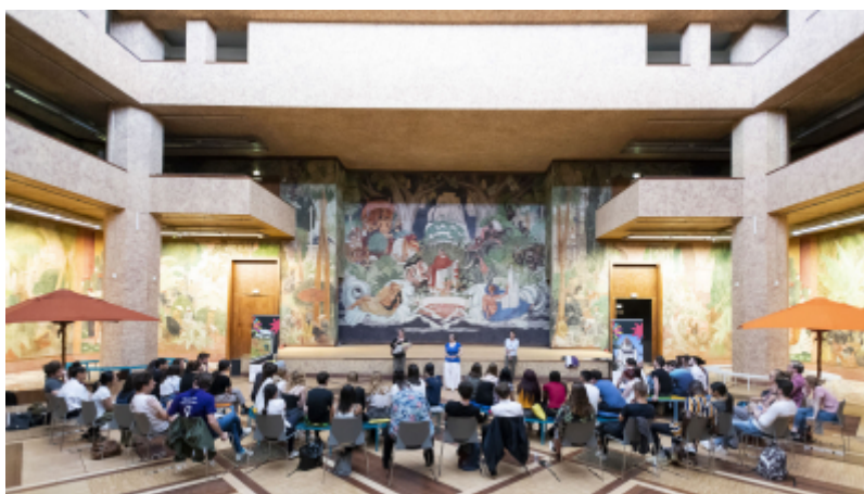
CRT Paris IDF_Cédric Helsly