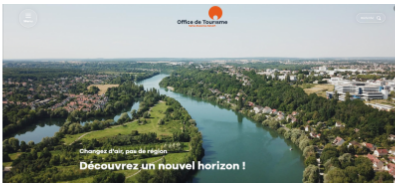
OT Grand Paris Sud

Le nouveau site internet de l'OT Grand Paris Sud est en ligne depuis le 20 décembre dernier. Il a été réalisé avec l'appui technique de l'agence Raccourci et financé par la Région Île-de-France et le Département de l'Essonne.