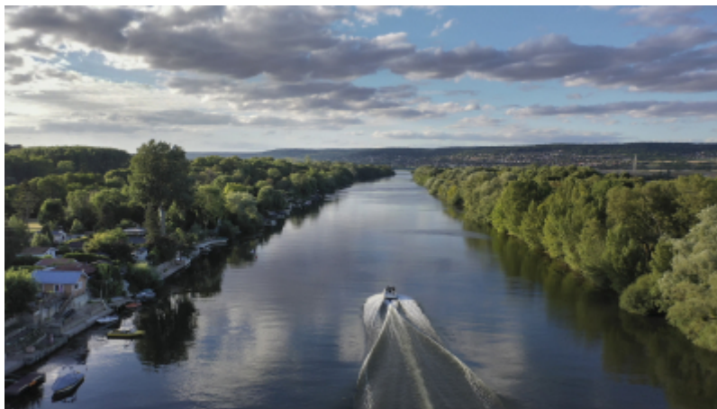
OTI Terres de Seine

L'Office de Tourisme Terres de Seine poursuit son essor et accompagne toujours un peu plus ses partenaires. En ce début d'année, ceu