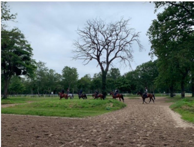
OT de Maisons-Laffitte

L'Office de Tourisme de Maisons-Laffitte étend son offre groupes en développant une nouvelle prestation pour les scolaires. Conçue en partenariat avec l'Ecole des Courses Hippiques AFASEC, cette nouvelle offre consiste à faire découvrir aux élèves les activités liées aux soins et à l'entretien des chevaux de course à Maisons-Laffitte.