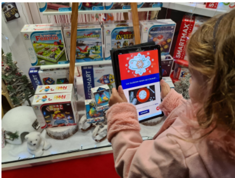
OT de Nemours

L'Office de Tourisme du Pays de Nemours invite ses visiteurs à découvrir le Pays de Nemours avec l'application Baludik à télécharger gratuitement sur smartphone ou tablette !