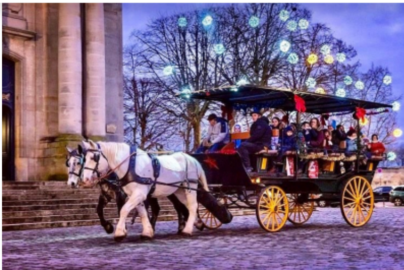
Les calèches de Versailles

L'été dernier, la Région Île-de-France a proposé 1500 visites guidées gratuites aux Franciliens . Cette opération est reconduite pour cette fin d'année !