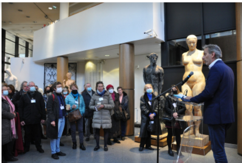
OT de Boulogne-Billancourt

Malgré une conjoncture encore aléatoire, l'Office de Tourisme de Boulogne-Billancourt a organisé, le 24 novembre dernier, un eductour à l'intention des comités d'entreprises, associations, CCAS et conférenciers pour découvrir les musées de la ville (Musée des années 30, Musée Paul Landowski et Musée Paul Belmondo) ainsi que le Parcours des Années 30, référence internationale de cette époque flamboyante de l'Art Déco.