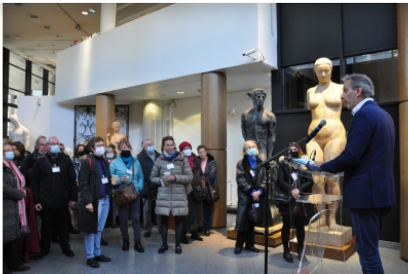
OT de Boulogne-Billancourt

Malgré une conjoncture encore aléatoire, l'Office de Tourisme de Boulogne-Billancourt a organisé, le 24 novembre dernier, un eductour à l'intention des comités d'entreprises, associations, CCAS et conférenciers pour découvrir les musées de la ville (Musée des années 30, Musée Paul Landowski et Musée Paul Belmondo) ainsi que le Parcours des Années 30, référence internationale de cette époque flamboyante de l'Art Déco.