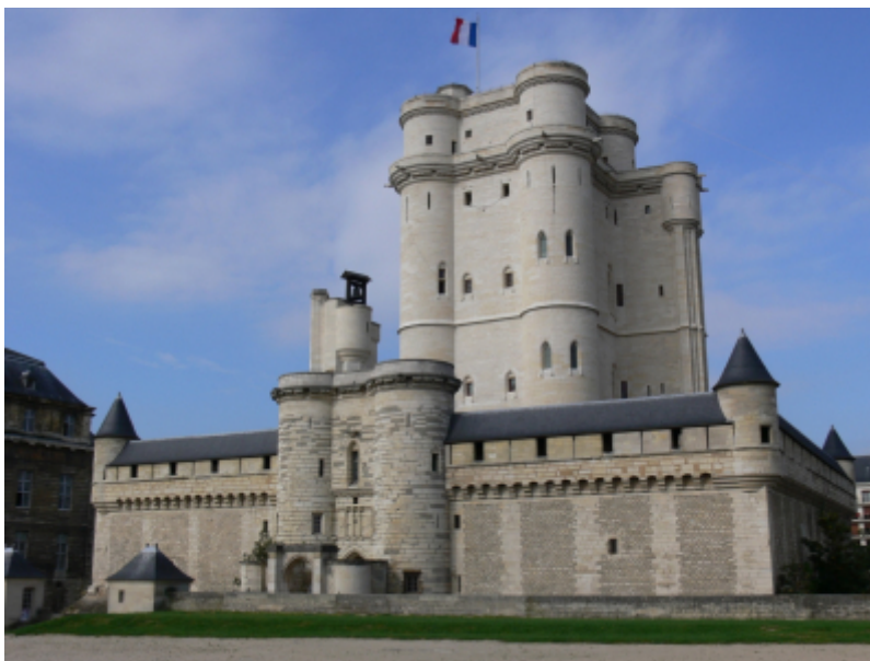
Ville de Vincennes