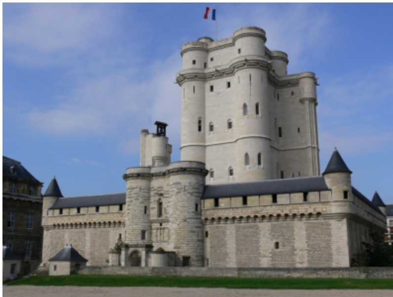
Ville de Vincennes