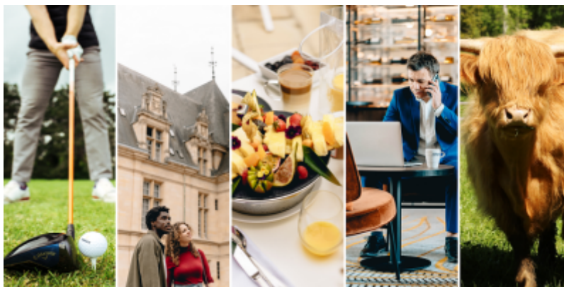
OT Grand Roissy

Depuis la rentrée, le territoire du Grand Roissy se revitalise ! Cette effervescence est l'occasion rêvée pour lancer son e-learning de destination.