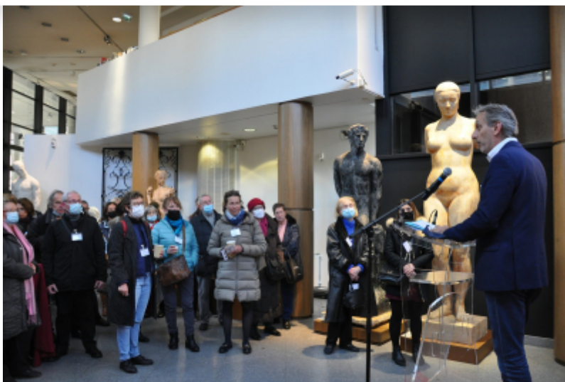
OT de Boulogne-Billancourt

Malgré une conjoncture encore aléatoire, l'Office de Tourisme de Boulogne-Billancourt a organisé, le 24 novembre dernier, un eductour à l'intention des comités d'entreprises, associations, CCAS et conférenciers pour découvrir les musées de la ville (Musée des années 30, Musée Paul Landowski et Musée Paul Belmondo) ainsi que le Parcours des Années 30, référence internationale de cette époque flamboyante de l'Art Déco.