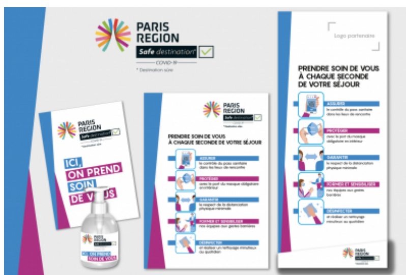
Le matériel à disposition : vitrophanie, gel, affiche, kakémono - CRT Paris IdF

Avec la démarche « Safe destination Covid-19 » destinée aux professionnels du tourisme francilien, la Région Île-de-France s'engage à vos côtés pour accueillir les visiteurs.