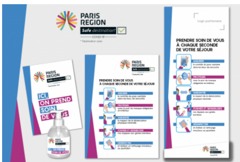
Le matériel à disposition : vitrophanie, gel, affiche, kakémono - CRT Paris IdF

Avec la démarche « Safe destination Covid-19 » destinée aux professionnels du tourisme francilien, la Région Île-de-France s'engage à vos côtés pour accueillir les visiteurs.