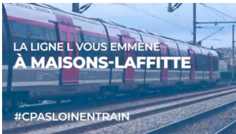
Office de Tourisme de Maisons-Laffitte

L'Office de Tourisme de Maisons-Laffitte a établi un partenariat avec la ville de Maisons-Laffitte et la SNCF. Cette collaboration s'inscrit dans l'objectif de la SNCF de rendre ses gares plus attractives auprès des voyageurs. Elle permet également à la ville de mettre en valeur son patrimoine culturel.