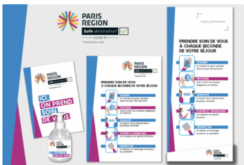
Le matériel à disposition : vitrophanie, gel, affiche, kakémono - CRT Paris IdF

Avec la démarche « Safe destination Covid-19 » destinée aux professionnels du tourisme francilien, la Région Île-de-France s'engage à vos côtés pour accueillir les visiteurs.