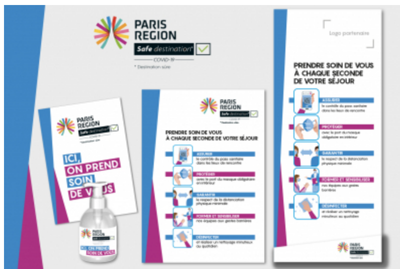
Le matériel à disposition : vitrophanie, gel, affiche, kakémono - CRT Paris IdF

Avec la démarche « Safe destination Covid-19 » destinée aux professionnels du tourisme francilien, la Région Île-de-France s'engage à vos côtés pour accueillir les visiteurs.