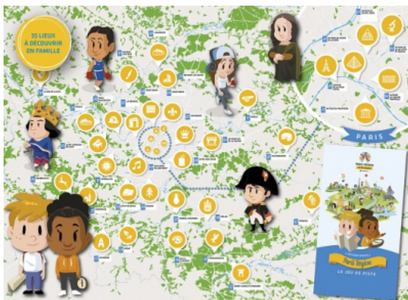
CRT Paris IdF

Ce sont désormais 35 aventures dans les 8 départements d'Île-de-France qui composent l'application gratuite Paris Region Aventures, le jeu de piste géant adapté aux enfants.