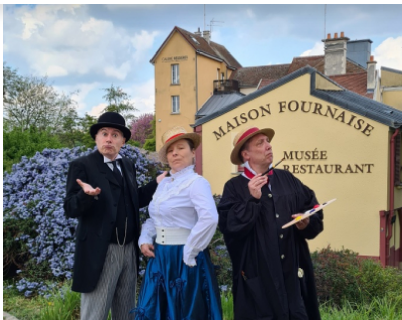
Office de Tourisme Saint Germain Boucles de Seine

Dès la sortie du dernier confinement, l'Office de Tourisme Saint Germain Boucles de Seine a fait le pari de lancer des Cluedo® Géants aux côtés des comédiens de la troupe d'Artistes & Compagnie.