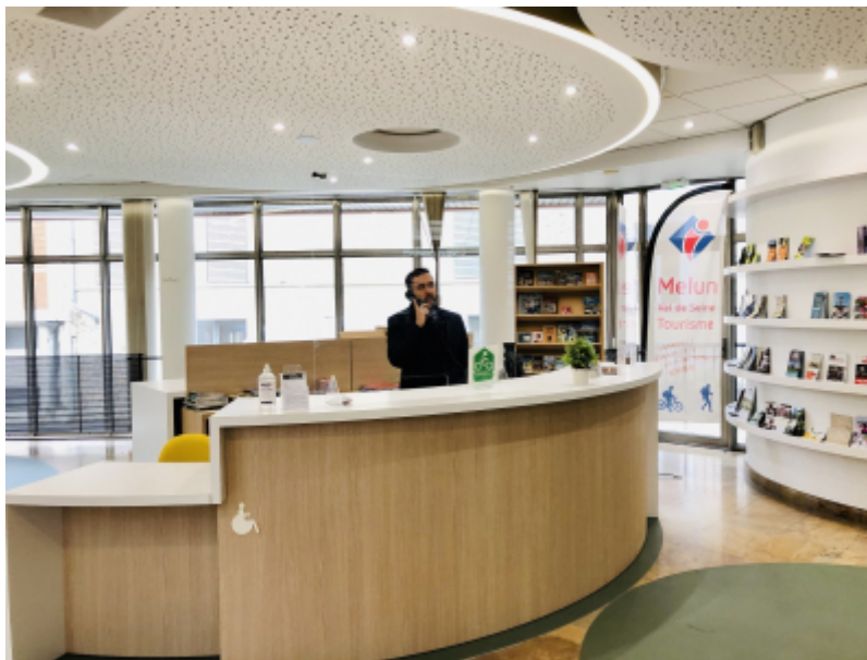
Office de Tourisme de Melun Val de Seine

L'Office de Tourisme de Melun Val de Seine travaille depuis un an à la création d'un nouvel espace d'accueil dédié aux habitants et aux visiteurs.