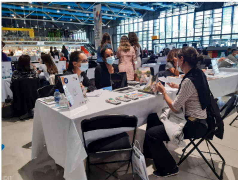
Issy Tourisme International

Issy Tourisme International a participé à la 19 ème édition du Forum des Loisirs Culturels Franciliens organisé par le CRT, le 14 septembre dernier, au Centre Pompidou.