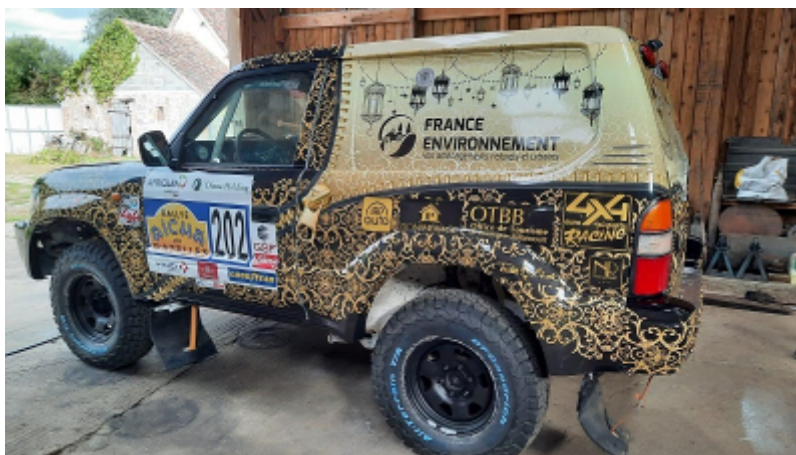
AIËCHA 2021/OT de Boulogne Billancourt

Après plusieurs sponsorismes avant la crise sanitaire, l'Office de Tourisme de Boulogne-Billancourt accompagne cette année deux équipages : « YUME AVENTURE » pour le Rallye « AIËCHA les Gazelles » au Maroc, et trois partenaires « DRÔLES DE DAMES » pour le rallye « RAID Aventure » en Thaïlande.