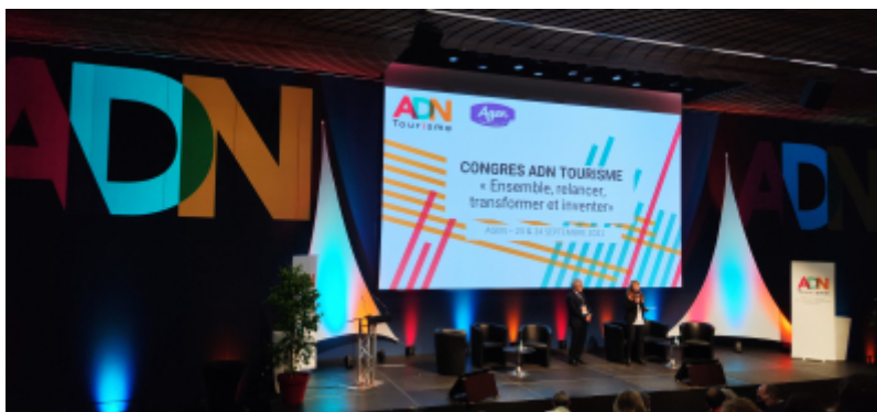
CRT Paris Île-de-France

Les 23 et 24 septembre 2021 se tenait le 1er congrès national d'ADN Tourisme qui a permis de rassembler près de 700 acteurs insti