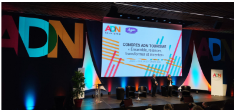
CRT Paris Île-de-France

Les 23 et 24 septembre 2021 se tenait le 1er congrès national d'ADN Tourisme qui a permis de rassembler près de 700 acteurs insti