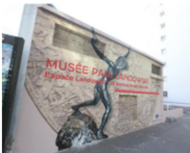
Office de Tourisme de Boulogne-Billancourt

L'Office de Tourisme de Boulogne-Billancourt lance un appel à projet pour un quatrième Mur peint afin de valoriser les Années 30 et l'Art Déco en continuant de promouvoir le patrimoine historique et culturel de la ville.