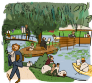
CRT Paris IdF

Inscrivez-vous au parcours de micro-formation gratuit sur la Destination Impressionnisme !