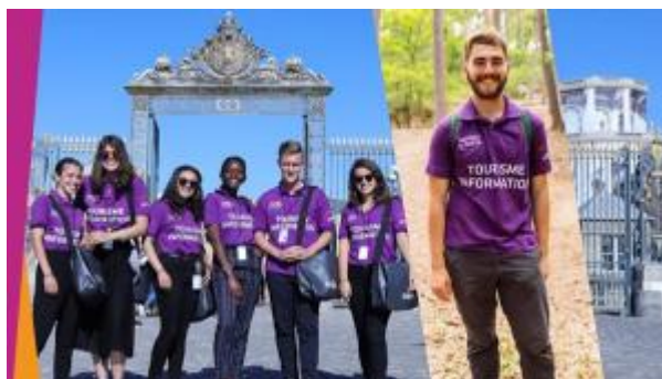
CRT Paris IdF

Les Volontaires du tourisme sont de retour !