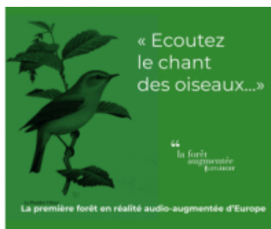
Plaine Vallée Tourisme

La première forêt audio augmentée d'Europe : une expérience gratuite, inédite, immersive et poétique en plein cœur de la forêt domaniale de Montmorency, à moins de 20 km de Paris.