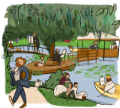
CRT Paris IdF

Inscrivez-vous au parcours de micro-formation gratuit sur la Destination Impressionnisme !