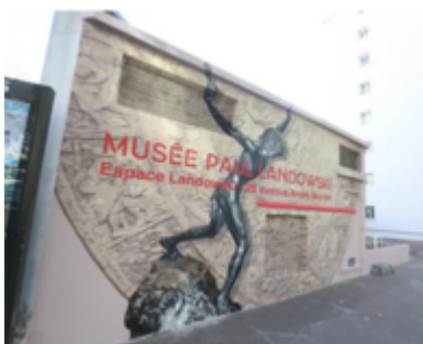
Office de Tourisme de Boulogne-Billancourt

L'Office de Tourisme de Boulogne-Billancourt lance un appel à projet pour un quatrième Mur peint afin de valoriser les Années 30 et l'Art Déco en continuant de promouvoir le patrimoine historique et culturel de la ville.