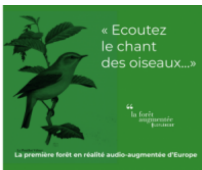
Plaine Vallée Tourisme

La première forêt audio augmentée d'Europe : une expérience gratuite, inédite, immersive et poétique en plein cœur de la forêt domaniale de Montmorency, à moins de 20 km de Paris.