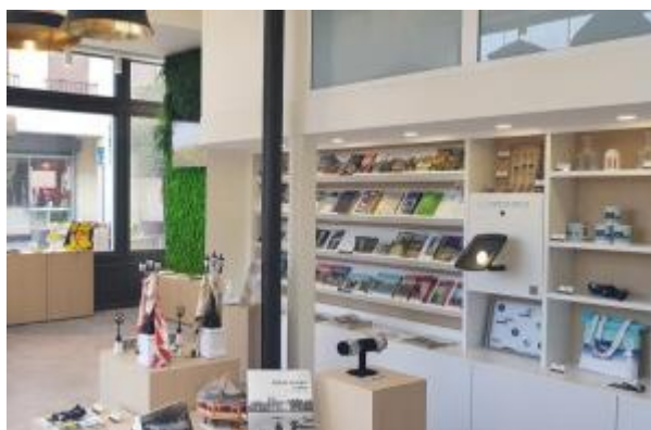
Office de Tourisme d'Enghien-les-Bains

Après plusieurs mois de travaux, l'équipe de l'Office de Tourisme d'Enghien-les-Bains accueillera bientôt ses visiteurs dans des locaux totalement réaménagés !