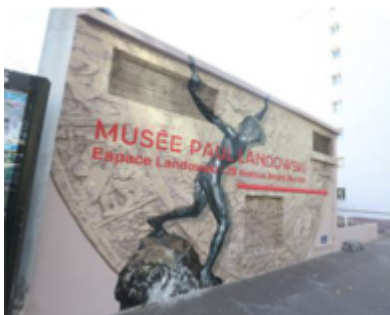
Office de Tourisme de Boulogne-Billancourt

L'Office de Tourisme de Boulogne-Billancourt lance un appel à projet pour un quatrième Mur peint afin de valoriser les Années 30 et l'Art Déco en continuant de promouvoir le patrimoine historique et culturel de la ville.