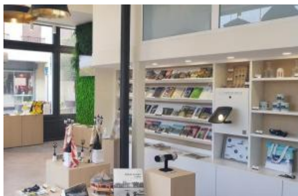
Office de Tourisme d'Enghien-les-Bains

Après plusieurs mois de travaux, l'équipe de l'Office de Tourisme d'Enghien-les-Bains accueillera bientôt ses visiteurs dans des locaux totalement réaménagés !