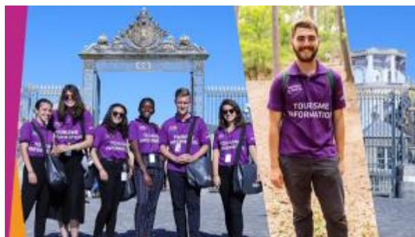
CRT Paris IdF

Les Volontaires du tourisme sont de retour !