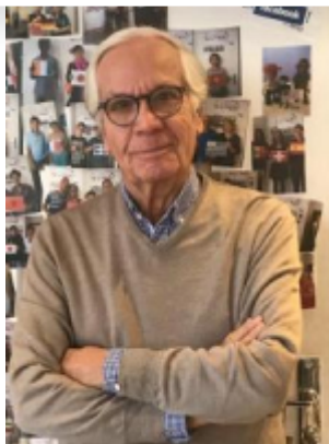
Office de Tourisme de Boulogne Billancourt

Office de Tourisme de Boulogne-Billancourt