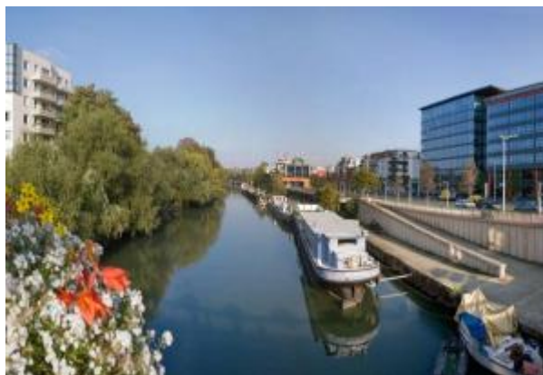
Office de Tourisme d'Issy les Moulineaux