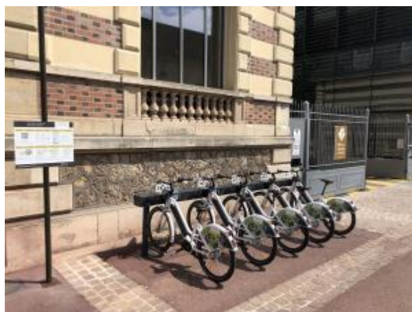
OT Saint Germain Boucles de Seine

Depuis début juin, l'Office de Tourisme Saint Germain Boucles de Seine loue des vélos à assistance électrique dans son bureau d'information touristique de Chatou et derrière l'OT de Saint-Germain-en-Laye. Mis en place par la société Green On , ces 10 vélos (5 à chaque borne) sont disponibles à la location en libre-service, 24h/24, 7j/7 pour une durée maximale de 24h.