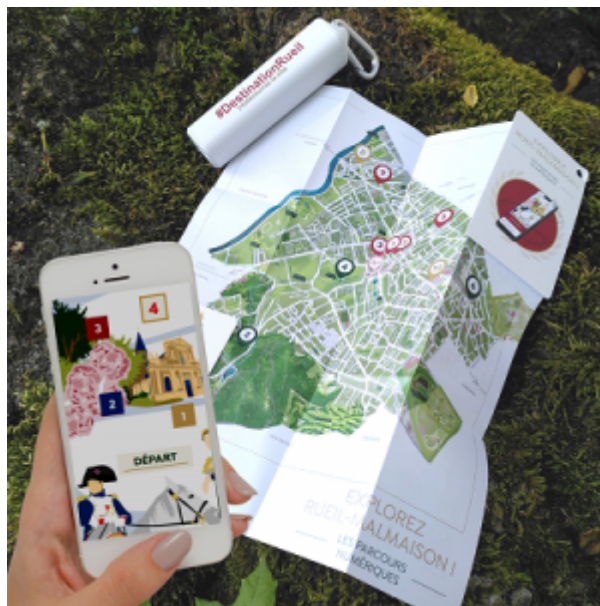
Office de Tourisme de Rueil Malamison

Face au succès du jeu de piste numérique « Sur les pas de Napoléon Ier à Napoléon III » l'Office de Tourisme de Rueil-Malmaison a développé 10 parcours thématiques grâce à la solution Baludik . Cette application permet de partir à l'aventure et de découvrir l'histoire tout en s'amusant. C'est aussi l'occasion de parcourir les espaces naturels préservés de la ville. Ces parcours numériques ne sont qu'un prétexte pour observer la beauté des paysages et les petits détails qui révèlent les secrets de ces lieux.