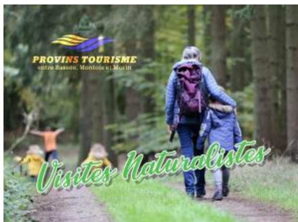
Office de Tourisme de Provins

En ces temps de retour à la nature et d'aspiration aux loisirs « démasqués », l'Office de Tourisme Intercommunautaire Provins Tourisme entre Bassée, Montois et Morin poursuit son virage vers le tourisme durable en invitant les visiteurs de passage à apprécier les espaces naturels de son territoire.