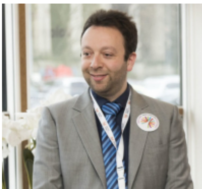
C. Helsly / CRT Paris Ile-de-France