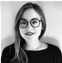
OT Grand Roissy