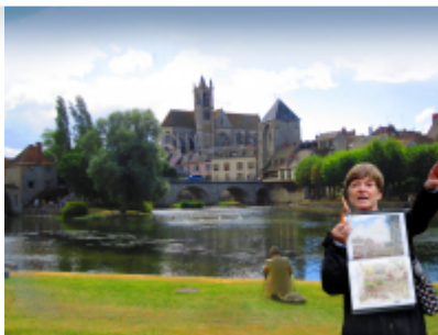
Office Tourisme Moret-sur-Loing

Il est encore possible de faire vos propositions de visites guidées qui seront financées par la Région Île-de-France. Cet été, des visites guidées gratuites seront proposées aux Franciliens afin de soutenir la profession des guides conférenciers et de valoriser le patrimoine naturel, culturel et les richesses touristiques des territoires de la destination.