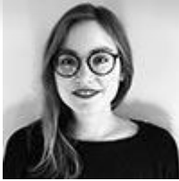
OT Grand Roissy