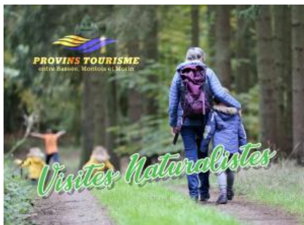
Office de Tourisme de Provins

En ces temps de retour à la nature et d'aspiration aux loisirs « démasqués », l'Office de Tourisme Intercommunautaire Provins Tourisme entre Bassée, Montois et Morin poursuit son virage vers le tourisme durable en invitant les visiteurs de passage à apprécier les espaces naturels de son territoire.