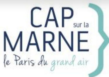
Logo Cap sur la Marne - Val-de-Marne Tourisme et Loisirs

Réunissant Val-de-Marne Tourisme & Loisirs, Seine-Saint-Denis Tourisme et les Offices de Tourisme de Paris - Vallée de la Marne et Marne & Gondoire, le collectif Cap sur la Marne propose cette année de nombreuses animations sur les bords de Marne. Embarquement à partir du mois de juin!