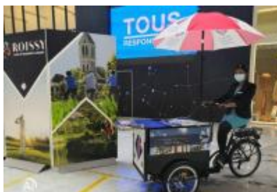
Grand Roissy tourisme

Ce printemps, l'Office de Tourisme Grand Roissy déploie pour la première fois son triporteur au centre commercial Aéroville. Ce nouvel outil de promotion remplace le stand utilisé pour toutes les opérations auxquelles le Grand Roissy participe localement : forum des associations, inaugurations, assemblées générales, Journées Européennes du Patrimoine, etc.