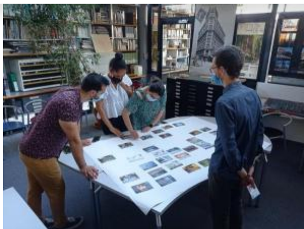
Issy Tourisme International

Dans le cadre de sa démarche ITI the Green One , l'équipe d'Issy Tourisme International a participé à un atelier collaboratif appelé « La fresque du Climat ».