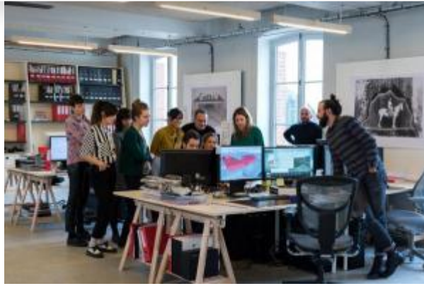
Marc Damage / CENTQUATRE-PARIS

Retrouvez les offres d'emplois et de stages diffusées par le réseau sur le portail professionnel du CRT .