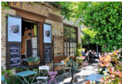
Comité Régional du Tourisme Paris Île-de-France

À la une : Comment valoriser les démarches environnementales au sein des activités touristiques ?