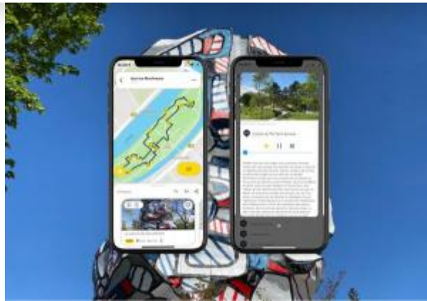
Issy Tourisme International