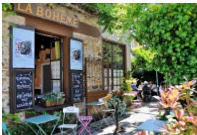
Comité Régional du Tourisme Paris Île-de-France