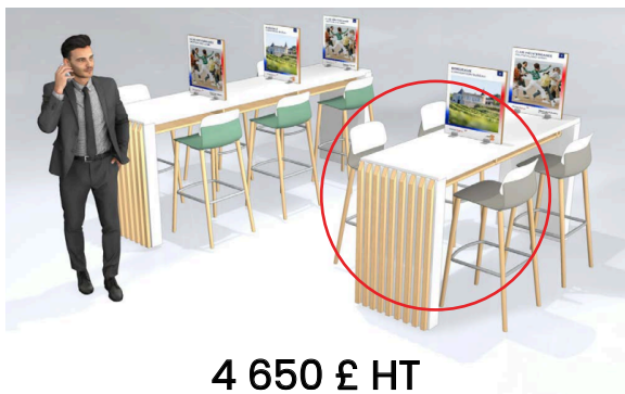
4 650 £ HT STAND SINGLE

Cette année, Atout France vous propose un Pavillon France avec :