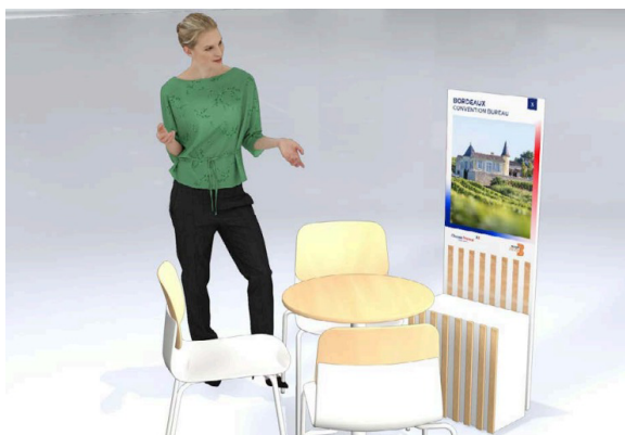
5 835 £ HT STAND CLASSIC