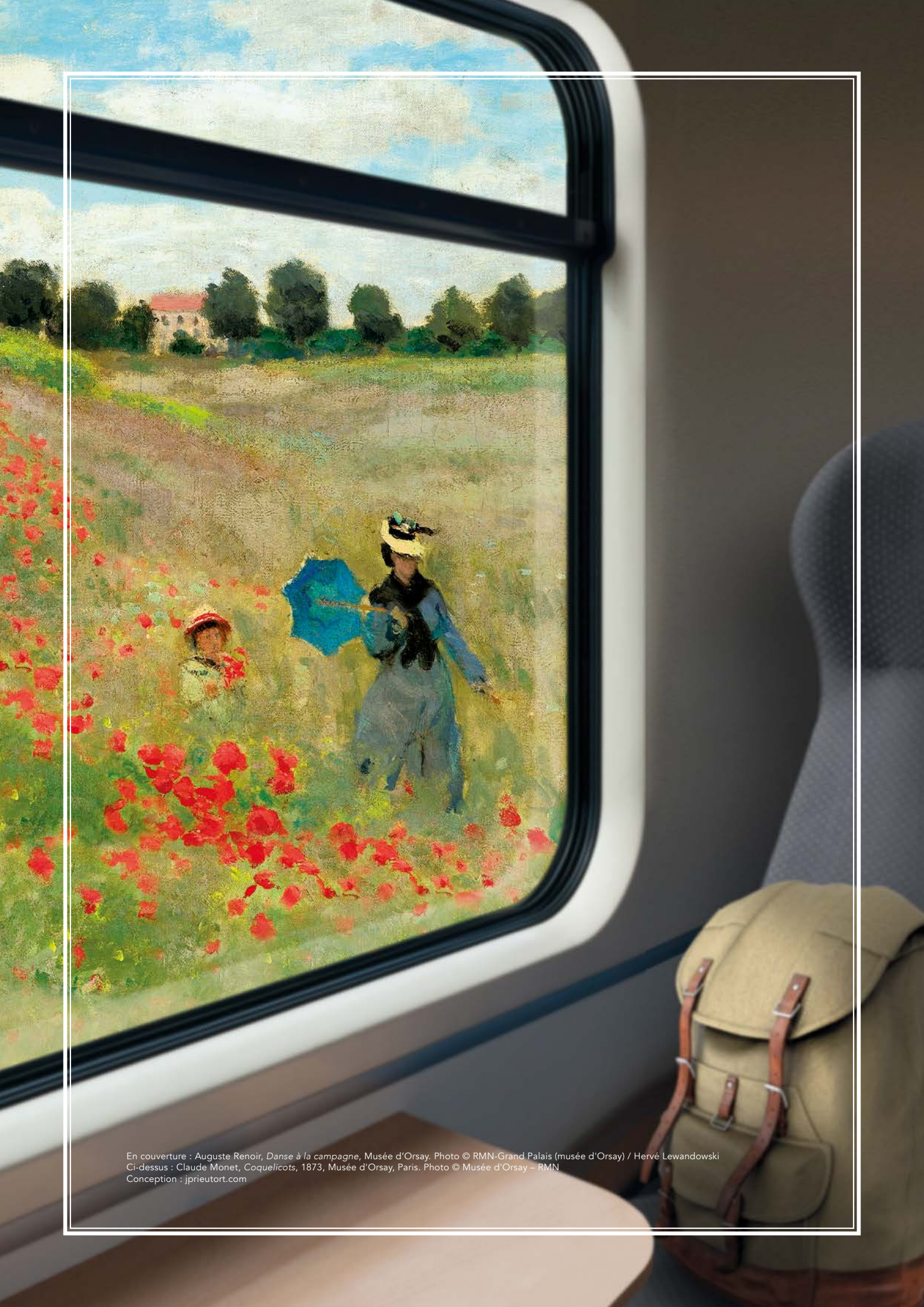
En couverture : Auguste Renoir, Danse à la campagne , Musée d'Orsay. Ci-dessus : Claude Monet, Coquelicots , 1873, Musée d'Orsay, Paris. Conception : jprieurtort.com