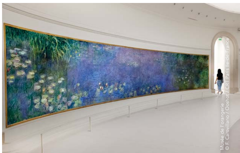
Musée de l'Orangerie © F. Carovillano / Ooshot / CRI | Paris Ile-de-France

Sur les bords de Seine à deux pas de Paris, autour de Chatou, où les joies des guinguettes et du canotage ont attiré les peintres, Auguste Renoir en tête, avides de nouveaux motifs.