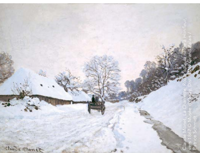
Claude Monet, La Charrette, Route sous la neige à Honfleur, vers 1867