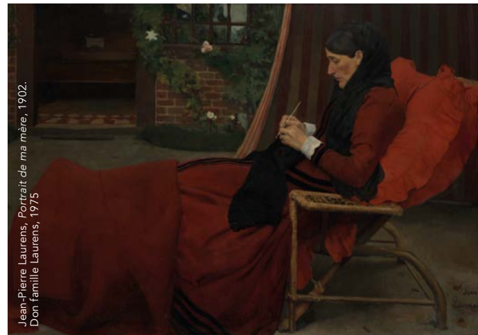
Jean-Pierre Laurens, Portrait de ma mère , 1902. Don famille Laurens, 1975

À travers des œuvres provenant de prêts exceptionnels, James Abbott McNeill Whistler, l'effet papillon a pour sujet la fascination que l'artiste révolutionnaire et dandy exerce entre 1874 et 1914, en France et en Europe. L'exposition révèle aussi la place de la critique qui en fait l'un des précurseurs de l'abstraction.