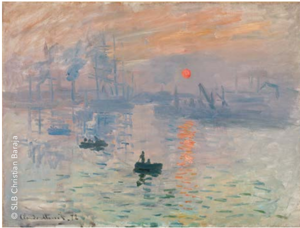
Claude Monet, Impression, soleil levant , 1872, Musée Marmottan Monet, Paris