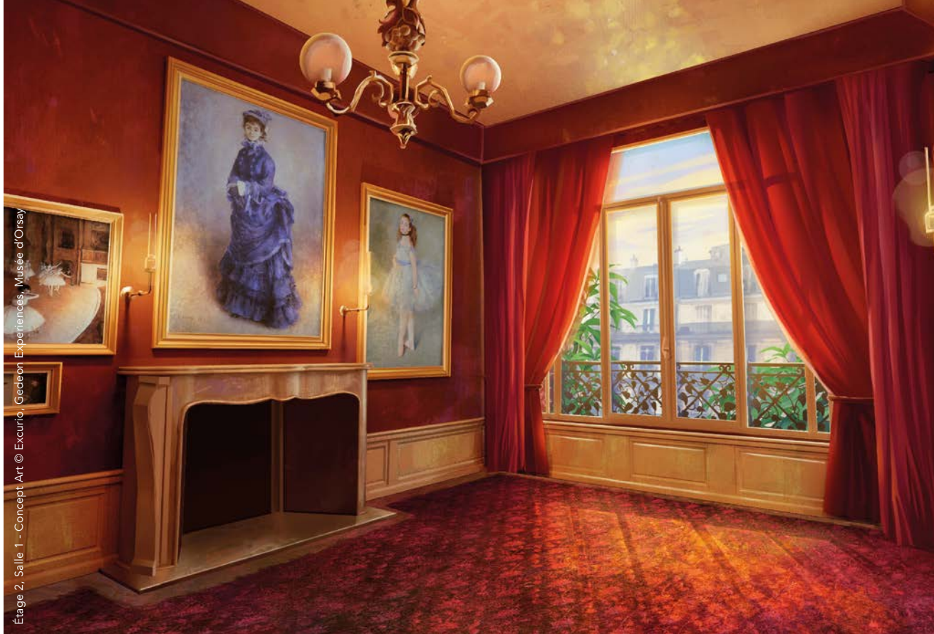
Étage 2, Salle 1 - Concept Art

Totalement novatrice, et pionnière dans sa conception, cette expédition immersive en réalité virtuelle résulte de plus de deux ans de travail, à la fois de recherche et d'analyse des sources sur lesquelles se fonde cette reconstitution de l'intérieur de l'atelier de Nadar et de la première exposition impressionniste, ici recréés le plus fidèlement possible. L'expérience en réalité virtuelle est enrichie de deux espaces de médiation en début et sortie de visite. Le premier amorce le voyage des visiteurs dans le Paris du début des années 1870, grâce à des archives évoquant une capitale en pleine mutation, aussi bien sur le plan architectural que social et artistique. Le second, conçu en partenariat avec les Voyages Impressionnistes , offre quant à lui un aperçu de la suite de l'aventure impressionniste en ancrant le parcours et les œuvres des peintres sur les territoires qui les ont inspirés, de Paris et sa région jusqu'en Normandie, sans oublier la Provence.