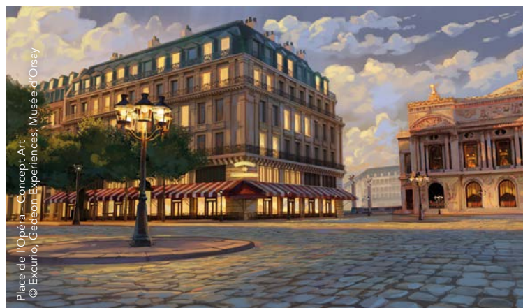
Place de l'Opéra - Concept Art © Excurio, Gedeon Experiences, Musée d'Orsay

Une coproduction EXCURIO – GEDEON Experiences – musée d'Orsay, sur une idée originale et des reconstitutions historiques inédites de GEDEON Experiences.