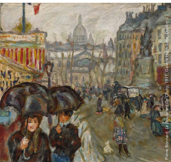
Pierre Bonnard, Le boulevard de Clichy, 1911 - Galerie Hugh Lane, Dublin

Au-delà des scènes de plage et des vues maritimes si familières aux Impressionnistes, cette exposition donne une nouvelle vision de l'attraction de ces artistes du plein air pour le grand large. Si l'image générique et plaisante des Impressionnistes à Deauville ou Cabourg est connue, le sujet marin est, dans cette exposition du Musée des impressionnistes Giverny, décliné selon de nouvelles perspectives thématiques et chronologiques. Les peintures des grands maîtres tels Eugène Boudin, Johan Barthold Jongkind, Claude Monet, Gustave Courbet ou encore Paul Gauguin dialoguent avec des œuvres moins connues créant ainsi un échange fécond entre peintures, dessins, estampes mais aussi photographies et documents d'époque.