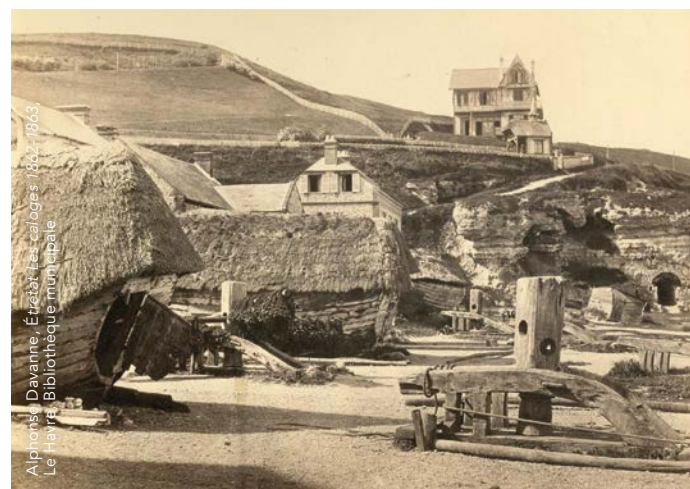
Alphonse Davanne, Étretat Les calvages 1862, 1863 Le Havre, Bibliothèque municipale

Terrain d'expérimentation pour les peintres du plein air, la Normandie a aussi joué un rôle décisif dans les débuts de la photographie. Chefs-d'œuvre de la peinture et de la photographie se répondent dans cette exposition qui fait de la Normandie le lieu idéal pour mesurer l'influence réciproque des arts.