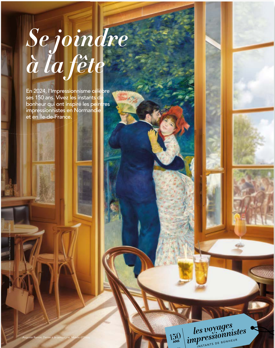
Auguste Renoir, Danse à la campagne, Musée d'Orsay

En 2024, l'Impressionnisme célèbre ses 150 ans. Vivez les instants de bonheur qui ont inspiré les peintres impressionnistes en Normandie et en Île-de-France.