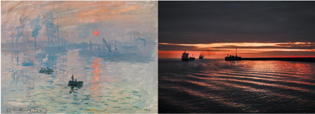
Claude Monet, Impression, soleil levant , 1872, Musée Marmottan Monet, Paris Le Havre, Normandie

Le Contrat « Normandie – Paris Île-de-France : Destination impressionnisme » a pour objectif de faire de ce territoire, berceau du mouvement impressionniste, une destination culturelle et une marque phare pour l'attractivité touristique de la France.