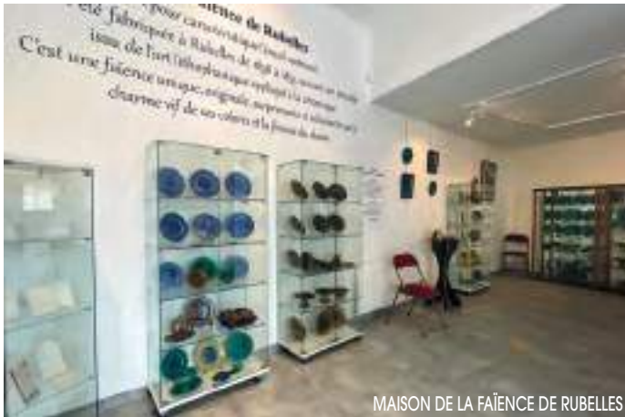
MAISON DE LA FAÏENCE DE RUBELLES