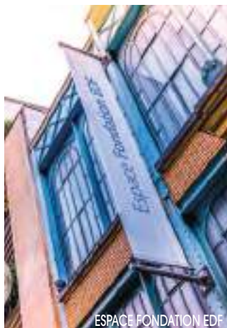
ESPACE FONDATION EDF