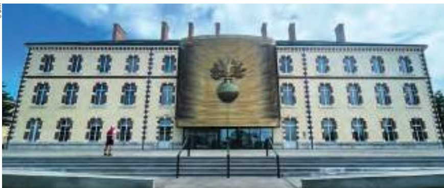
Le musée de la Gendarmerie nationale de Melun