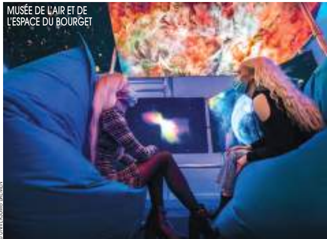
MUSÉE DE L'AIR ET DE L'ESPACE DU BOURGET