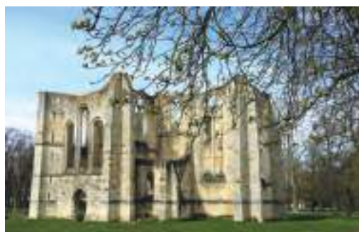
Les ruines de l'Abbaye Cistercienne Notre-Dame du Lys