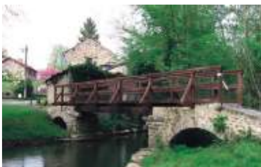
À Maincy, le pont rendu célèbre par le peintre Paul Cézanne

Qui dit visite d'un nouveau territoire, dit dégustation de saveurs locales. Le Brie de Melun, parfois considéré comme l'ancêtre de tous les bries, est à l'honneur. Ce fromage au lait cru bénéficie de l'appellation d'origine contrôlée (AOC) depuis 1980 et est proposé dans de nombreux restaurants labellisés. Le domaine des Macarons de Réau est également à voir. Depuis plus de quarante ans, l'entreprise familiale fabrique des macarons à l'ancienne.