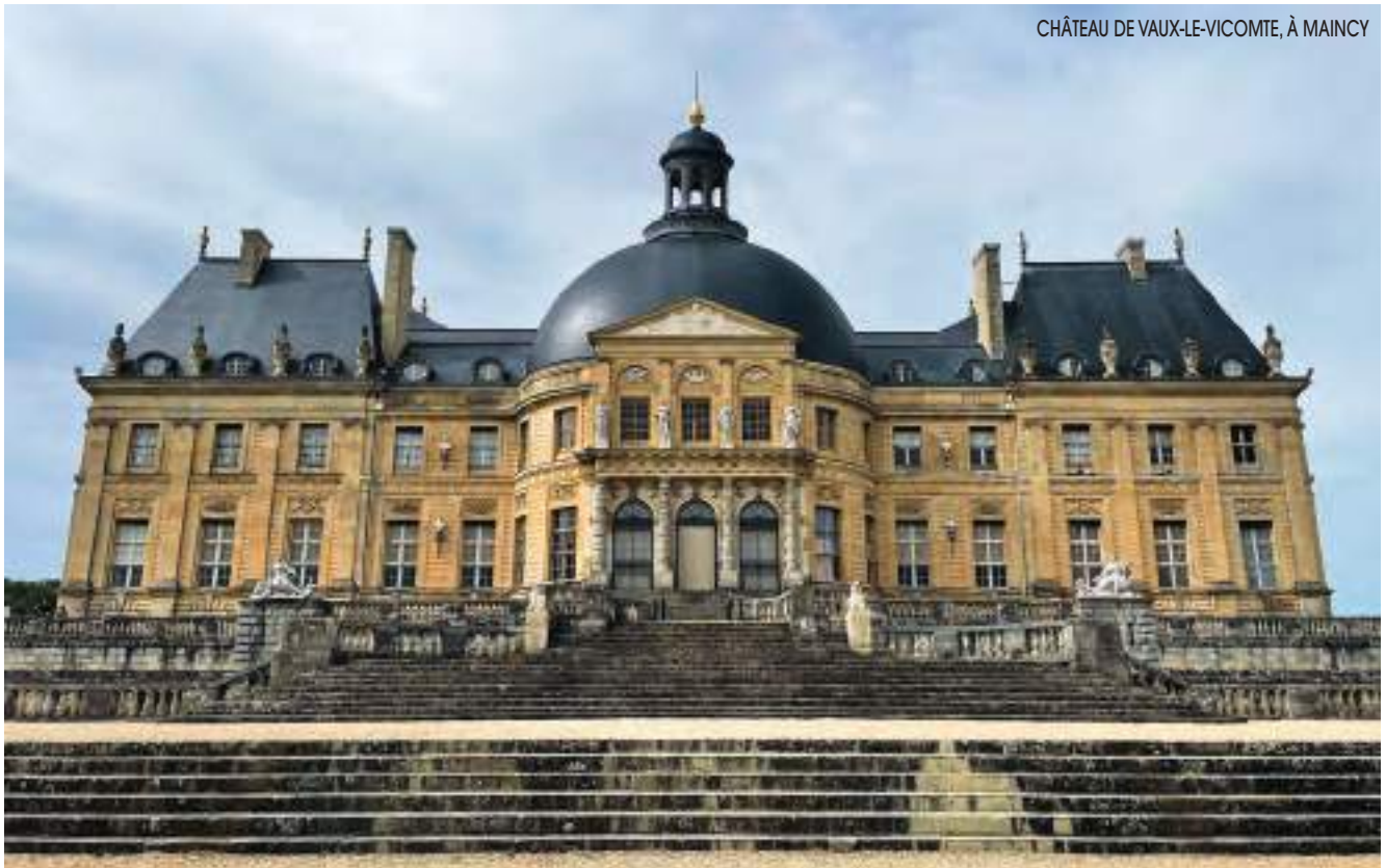
CHÂTEAU DE VAUX-LE-VICOMTE, À MAINCY