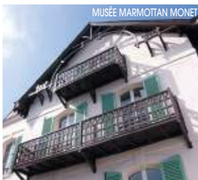
MUSÉE MARMOTTAN MONET

Les Yvelines jouent également le jeu. À Croissy-sur-Seine, le musée de