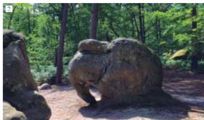
2 Le rocher de l'Éléphant, sculpture en roche naturelle, se trouve dans la forêt, à proximité de la commune de Larchant.