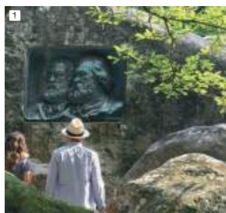
1 Les groupes en balade dans la forêt font souvent halte devant le médaillon Millet-Rousseau, en bronze, dans la roche, représentant les visages de profil des deux peintres.