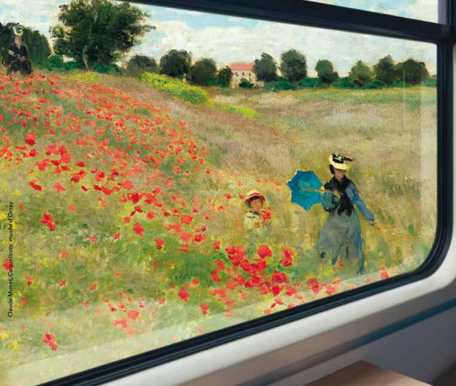
Claude Monet, Coquelicots, musée d'Orsay