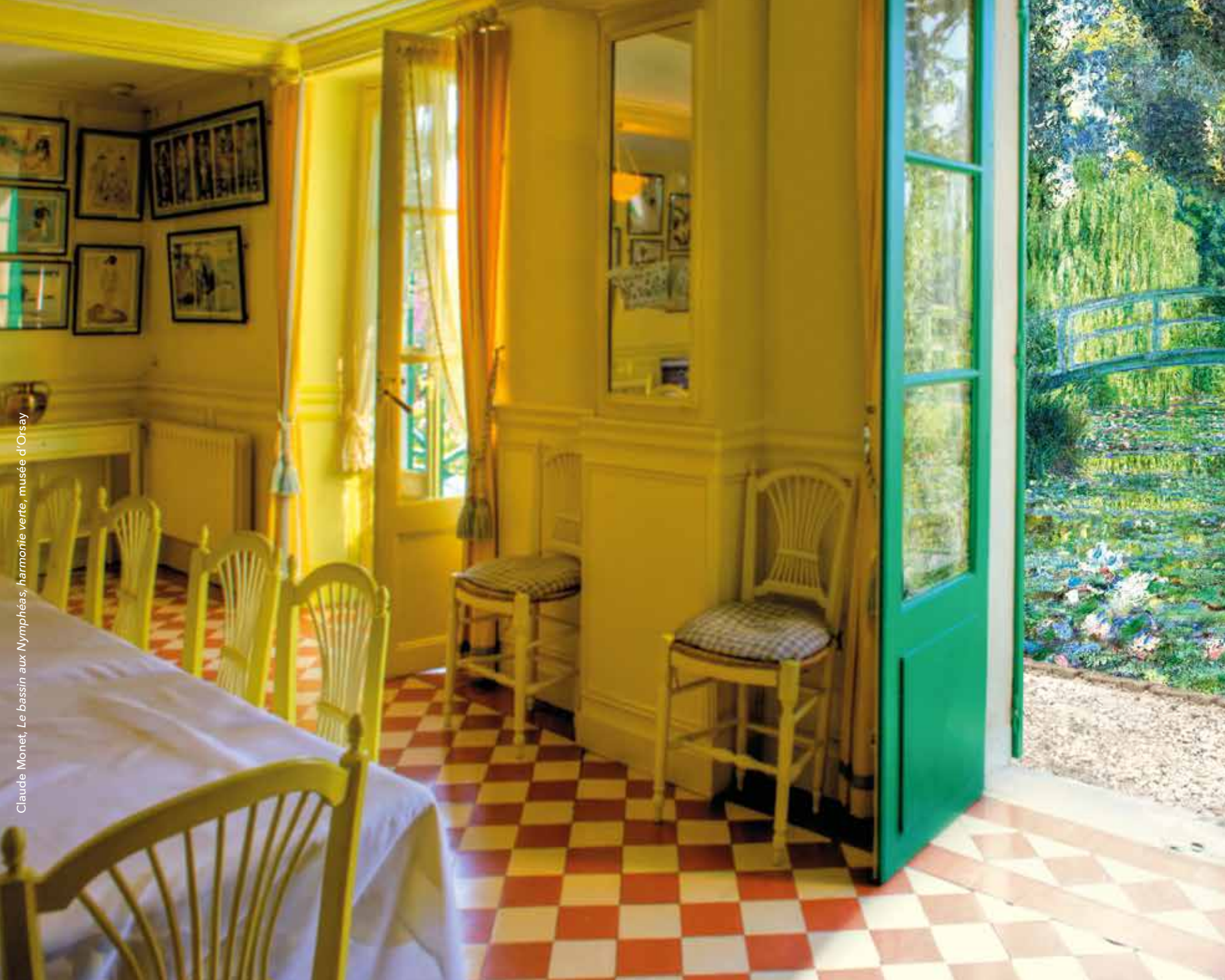
Claude Monet, Le bassin aux Nymphéas, harmonie verte, musée d'Orsay