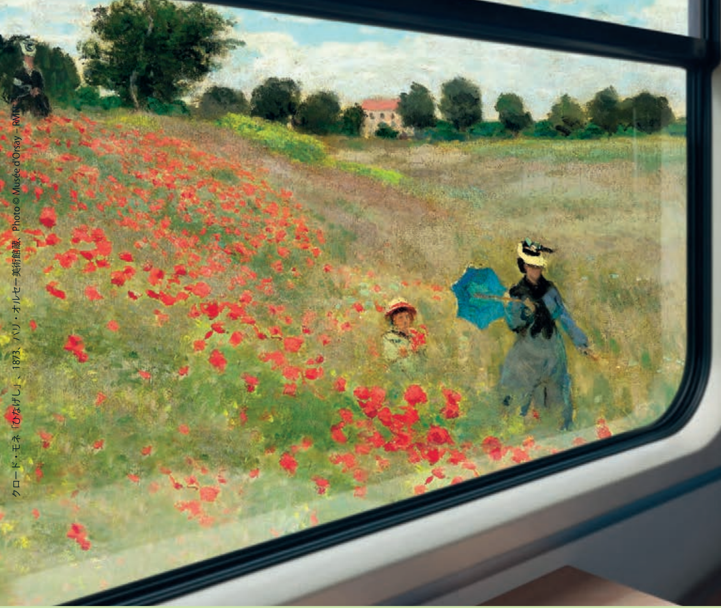
クロード・モネ「ひなげし」、1873、パリ・オルセー美術館蔵。