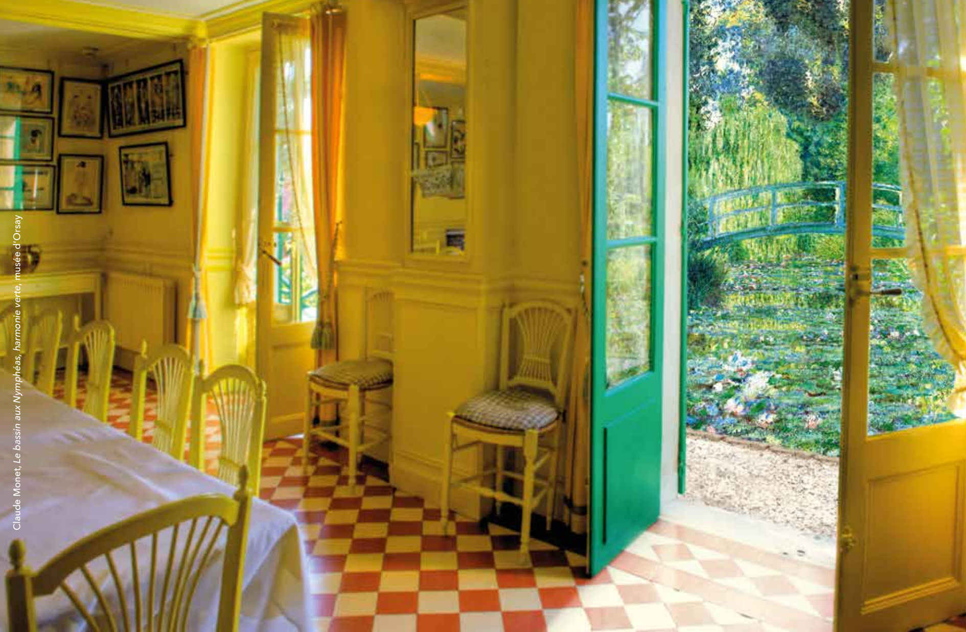
Claude Monet, Le bassin aux Nymphéas, harmonie verte, musée d'Orsay