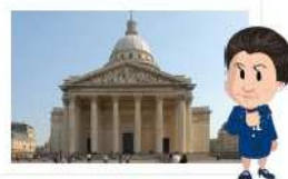
Autour du Panthéon