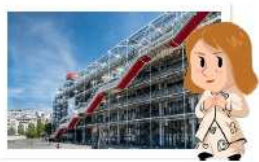
Autour du Centre Pompidou