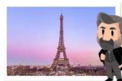
Autour de la tour Eiffel