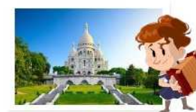
Autour du Sacré-Coeur