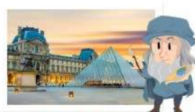
Autour du Louvre