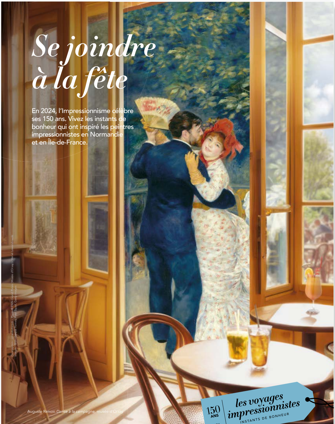
Auguste Renoir, Danse à la campagne, musée d'Orsay

En 2024, l'Impressionnisme célèbre ses 150 ans. Vivez les instants de bonheur qui ont inspiré les peintres impressionnistes en Normandie et en Île-de-France.