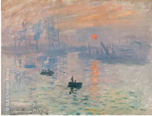
Claude Monet, Impression, soleil levant , 1872, Musée Marmottan Monet, Paris