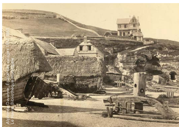
Alphonse Davanne, Étretat Les calvages 1862, 1863. Le Havre Bibliothèque municipale

Terrain d'expérimentation pour les peintres du plein air, la Normandie a aussi joué un rôle décisif dans les débuts de la photographie. Chefs-d'œuvre de la peinture et de la photographie se répondent dans cette exposition qui fait de la Normandie le lieu idéal pour mesurer l'influence réciproque des arts.