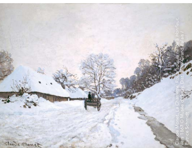
Claude Monet, La Charrette, Rouen sous la neige à Honfleur, vers 1867