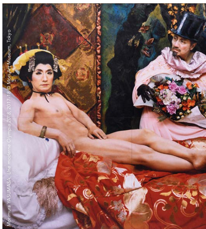
Morimura YASUMASA, Une moderne Olympia 2017-18 © Mori Art Museum, Tokyo

C'est l'histoire d'une influence réciproque entre les artistes japonais et français, du temps des Impressionnistes et à notre époque contemporaine. En confrontant des œuvres impressionnistes influencées par le Japonisme à des créations asiatiques contemporaines issues des collections du Mori Art Museum (Tokyo), les Franciscaines propose des regards croisés sur un dialogue artistique fécond. L'ouverture du Japon à l'Occident durant l'ère Meiji (1868-1912) permet la diffusion vers l'Europe de l'Ukiyo-e, image du monde flottant, auquel les Impressionnistes sont sensibles. Les peintres s'essayaient alors à l'estampe et intègrent des éléments japonisants dans leurs compositions. Aujourd'hui, des artistes asiatiques créent des œuvres qui ne sont pas sans rappeler celles conçues en Europe à la fin du XIX ème siècle, quand ils ne réinterprètent pas directement des tableaux impressionnistes. L'exposition interroge ces paradigmes par des mises en regards d'œuvres issues de collections normandes, nationales et internationales.