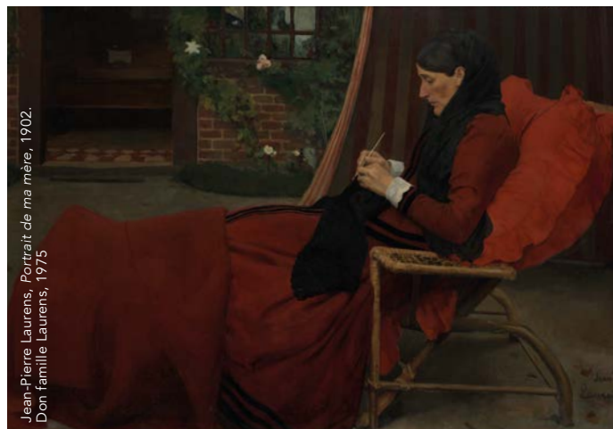
Jean-Pierre Laurens, Portrait de ma mère, 1902. Don famille Laurens, 1975

À travers des œuvres provenant de prêts exceptionnels, James Abbott McNeill Whistler, l'effet papillon a pour sujet la fascination que l'artiste révolutionnaire et dandy exerce entre 1874 et 1914, en France et en Europe. L'exposition révèle aussi la place de la critique qui en fait l'un des précurseurs de l'abstraction.